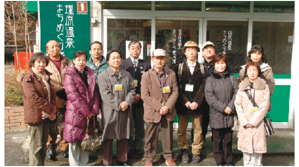
塩原温泉まちめぐり案内人

塩原温泉は、美しい山々、清らかな川、豊かに湧き出る温泉が自慢のまち。石にも木にも建物にも、多くの人々の物語が刻まれています。塩原が大好きな私たちが、塩原の魅力をたっぷりご案内いたします。