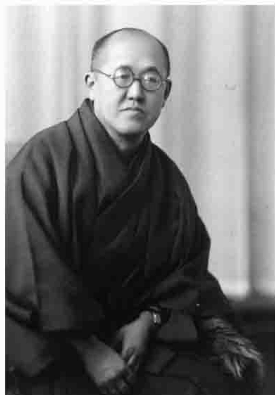
川瀬巴水 昭和14年撮影