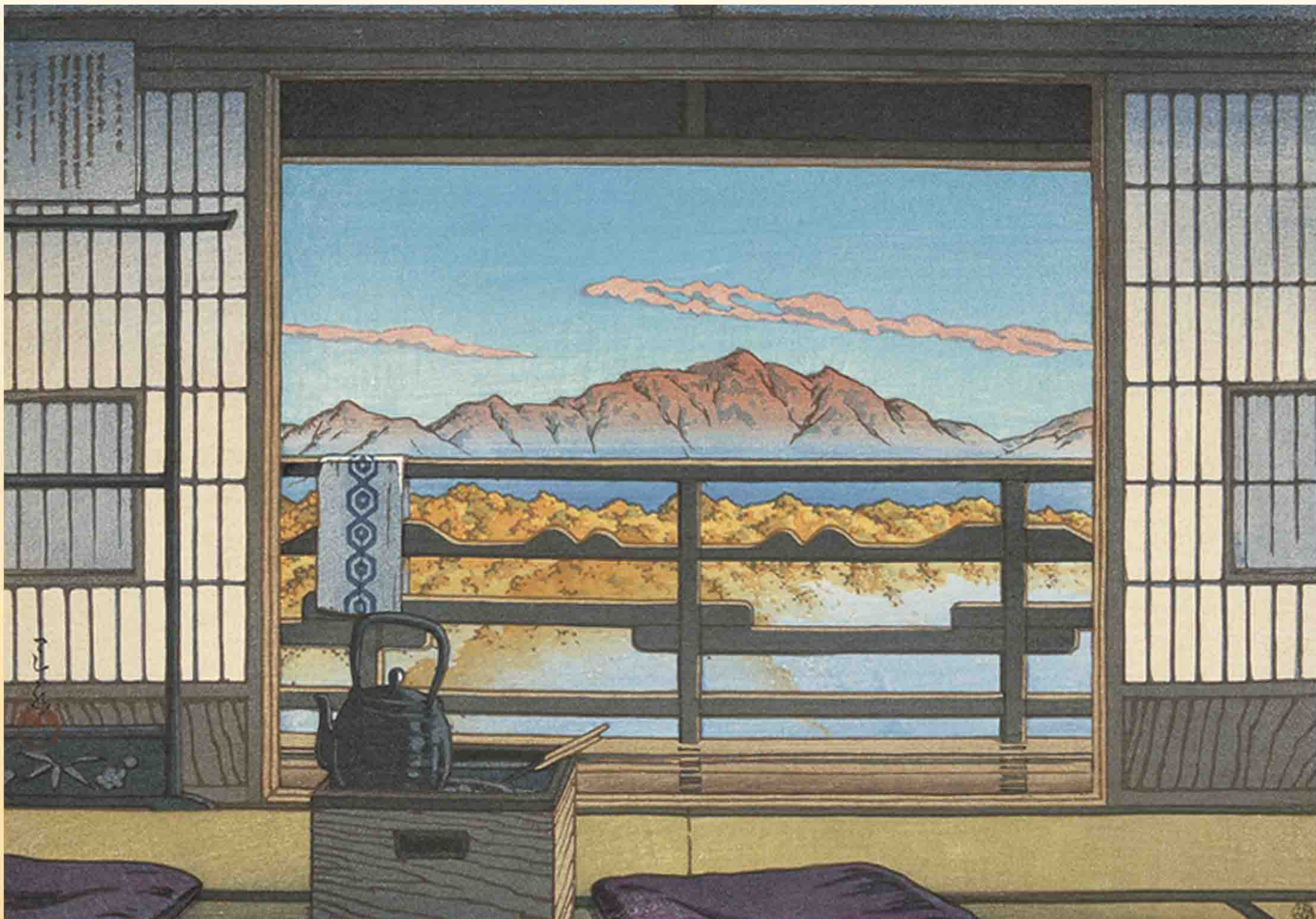
湯宿の朝(塩原新湯) 昭和21年(1946) 木版画