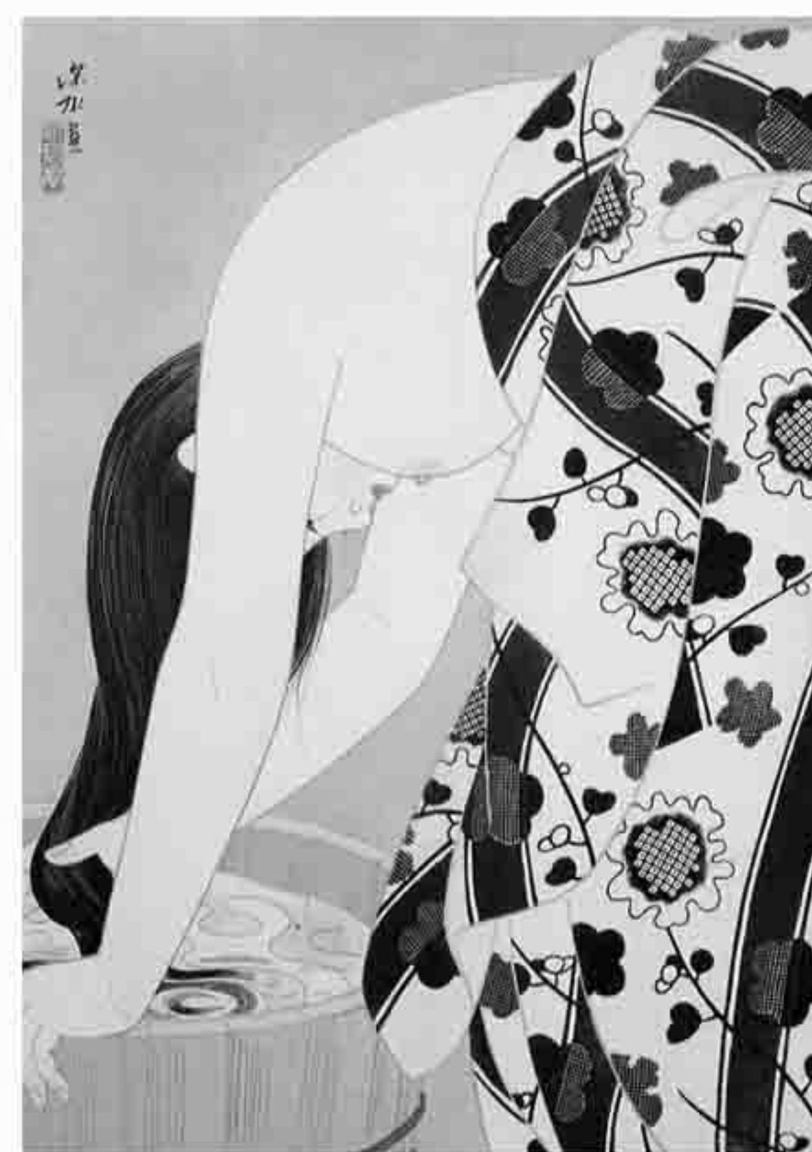
伊東深水「髪」昭和27年

当初は輸出用に作られ、江戸時代の木版画に比べ新版画は摺り度数が圧倒的に多く30~40度摺りをして、木版画とは思えない臨場感あるリアルな作品に仕上げ、外国人に大変喜ばれ多くの美術館やコレクターに収集され、スティーブ・ジョブズ氏もその一人でした。