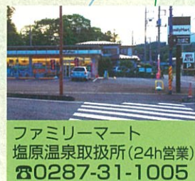
ファミリーマート 塩原温泉取扱所(24h営業) ☎0287-31-1005

カジカ釣り料金 ●料金(日釣券)2,000円 未就学児・小中学生は無料 障害者は半額 ※現場売りは2,000円プラス