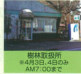
樹林取扱所 ※4月3日、4日のみ AM7:00まで