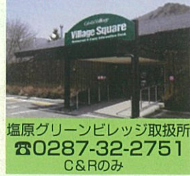
塩原グリーンビレッジ取扱所 ☎0287-32-2751 C&Rのみ