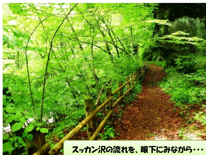
スッカン沢の流れを、眼下にみながら・・・