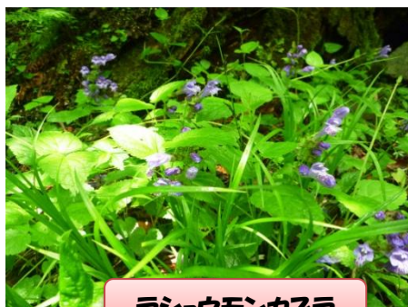
ラショウモンカスラ