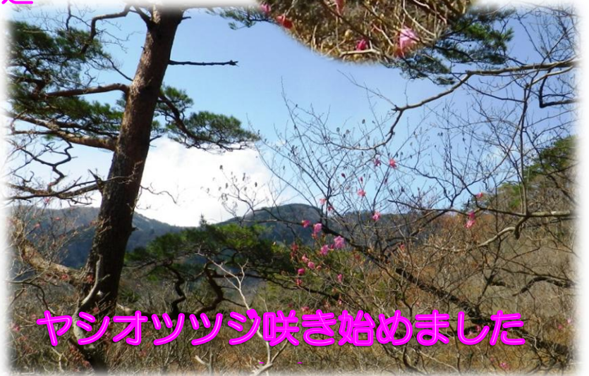
ヤシオツツジ咲き始めました