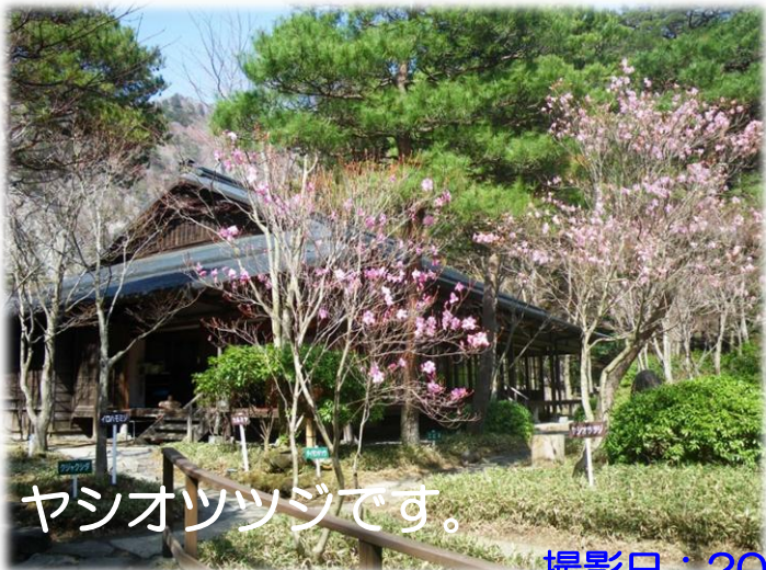
ヤシオツツジです。