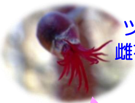
ツノハシバミ 雌花と長いのが雄花です