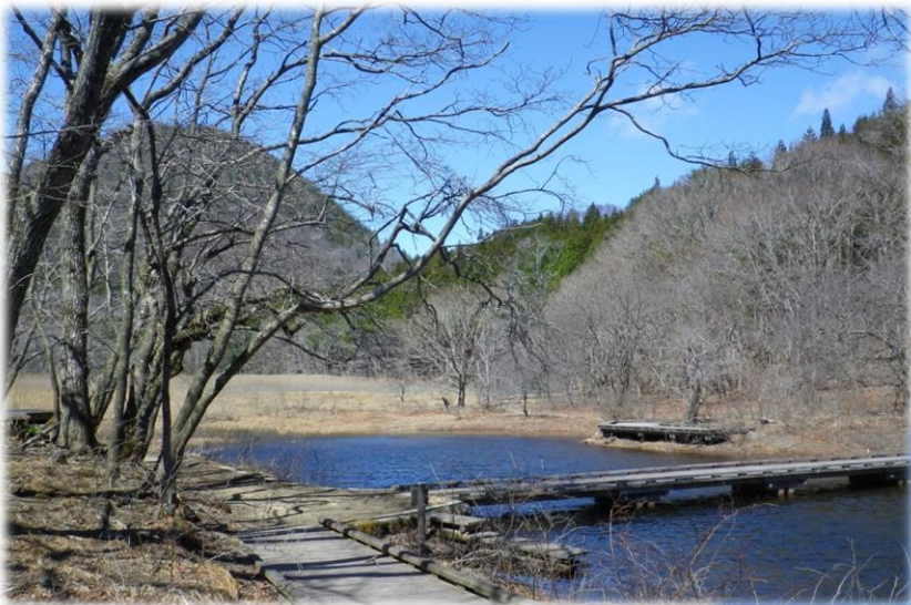
大沼木橋から見た 新湯富士と大沼です。