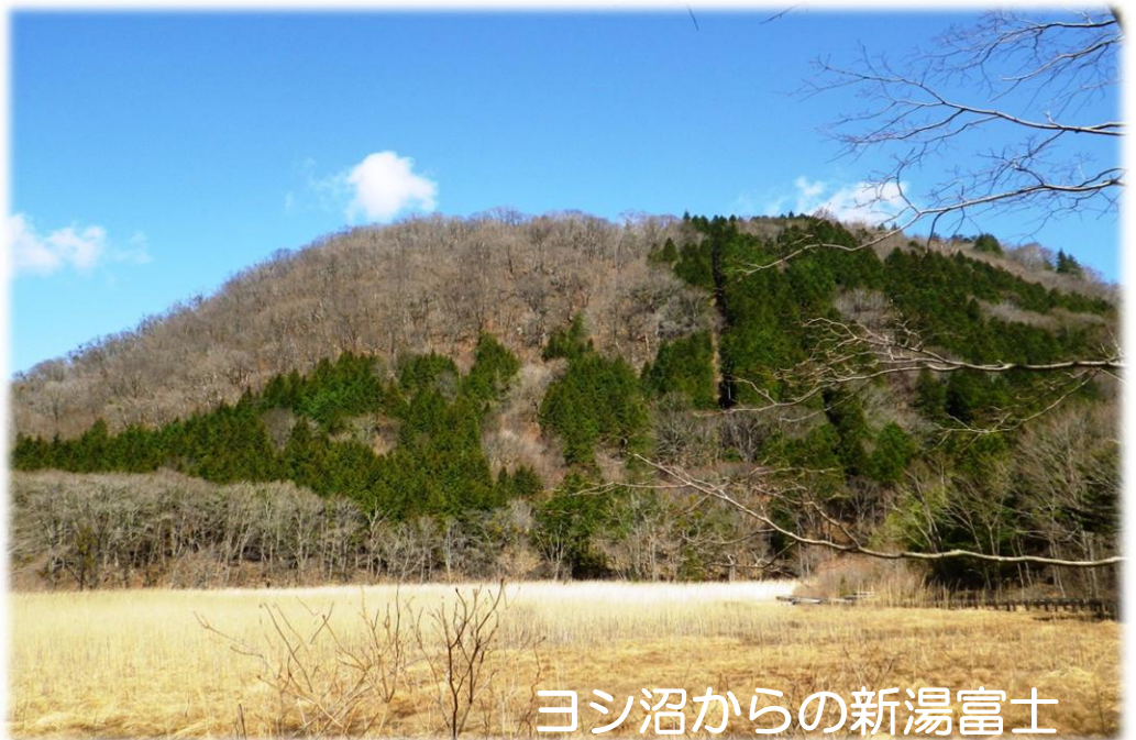
ヨシ沼からの新湯富士