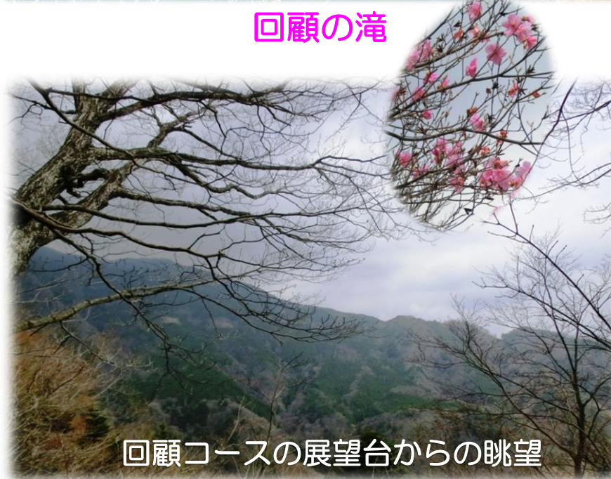
回顧コースの展望台からの眺望