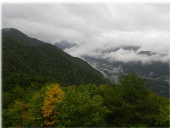
塩那スカイラインからの温泉街