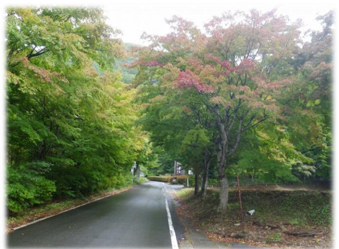
塩那スカイライン入口