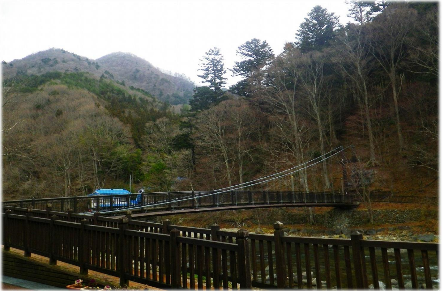
紅の吊橋（古町地区）