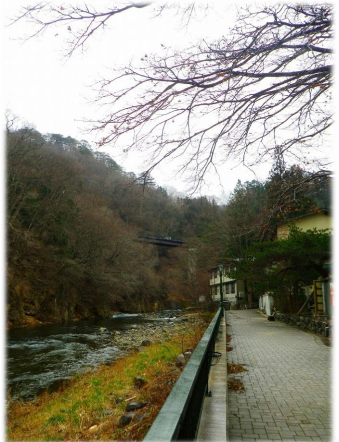
山ゆりの吊橋（畑下地区）