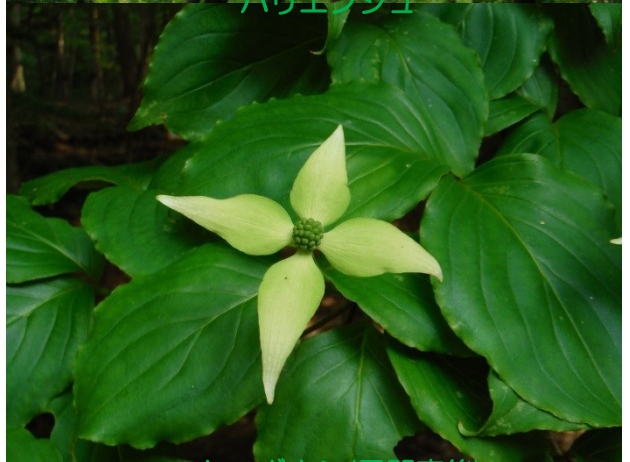
ヤマボウシ(展開直後)