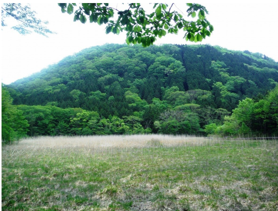
ヨシ沼からの新湯富士