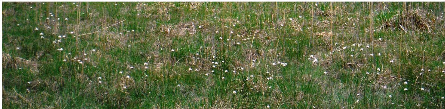
間もなく見頃を迎えるワタスゲ