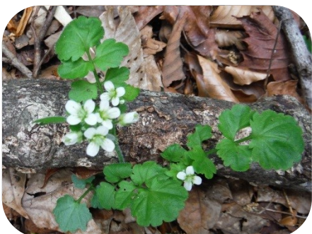
マルバコンロンソウ