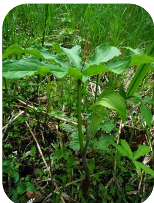
ヒロハテンナンショウ