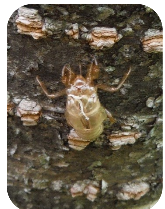
エゾハルゼミの抜け殻