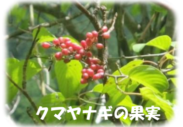
クマヤナギの果実