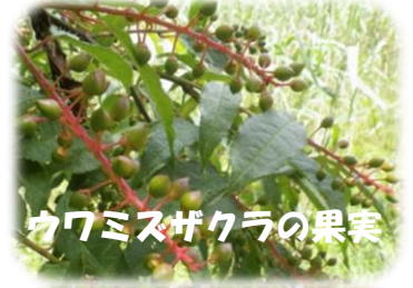
ウツミスガクラの果実