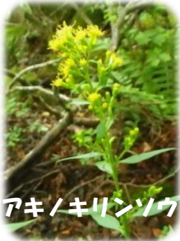
アキノキリンソウ