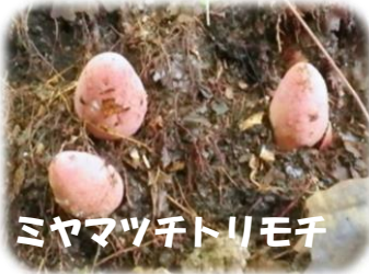
ミヤマツチトリモチ