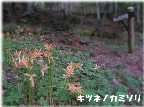
キツネノカミソリ