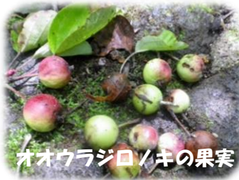
オオウラジロ/キの果実