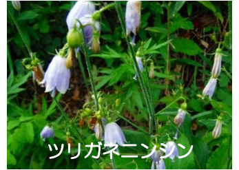
ツリガネニンジン