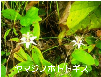
ヤマシノホトトギス