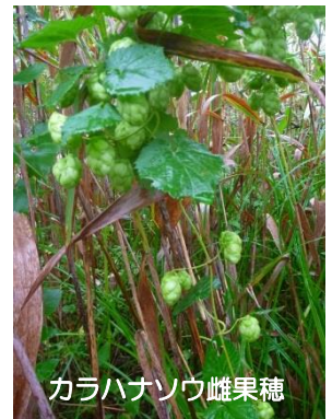
カラハナソウ雌果穂