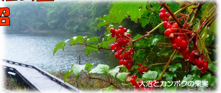
大沼とカンボクの果実

◆温泉街から少し足を延ばして、高原山麓のふもとと奥塩原温泉地区へ。標高が変わると、また違った季節の移ろいを感じることができます。