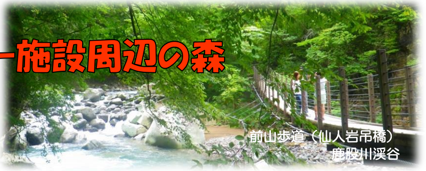
前山歩道（仙人岩吊橋） 鹿沼川溪谷