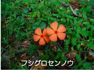
フシグロセンノウ