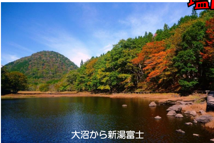
大沼から新湯富士