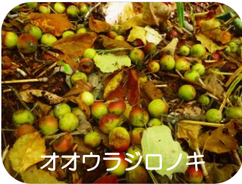
オオウラジロノキ