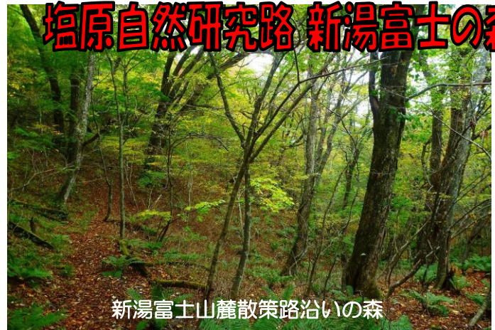
新湯富士山麓散策路沿いの森