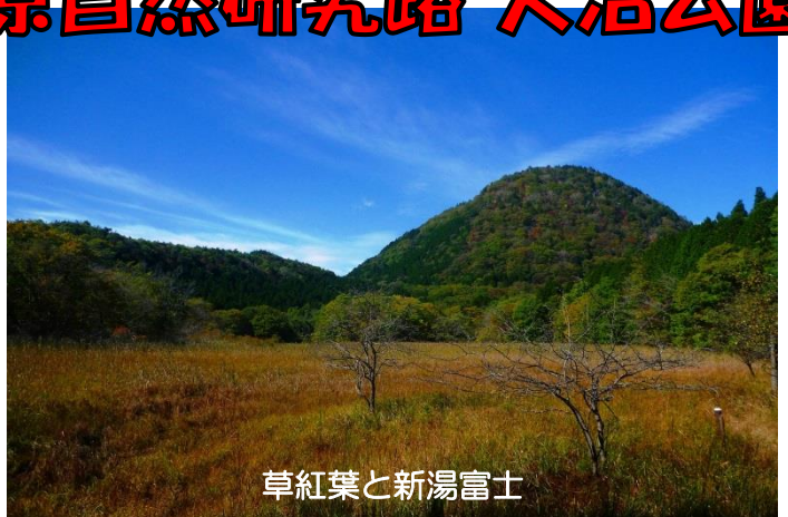
草紅葉と新湯富士