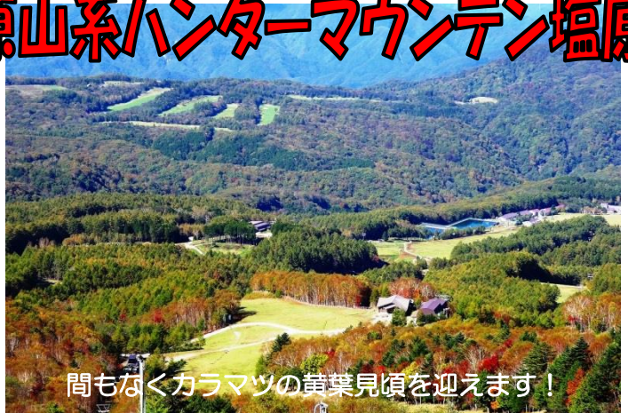
間もなくカラマツの黄葉見頃を迎えます！