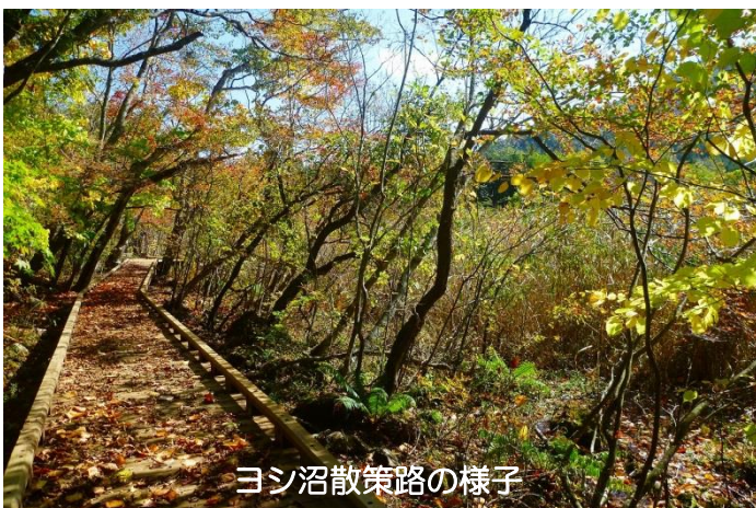
ヨシ沼散策路の様子