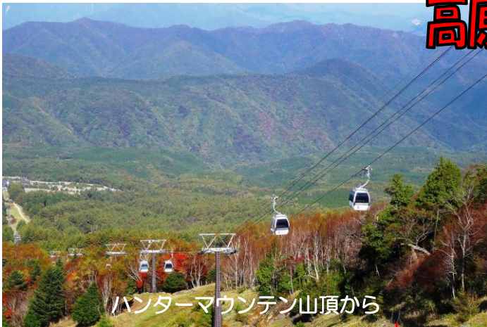
ハンターマウンテン山頂から