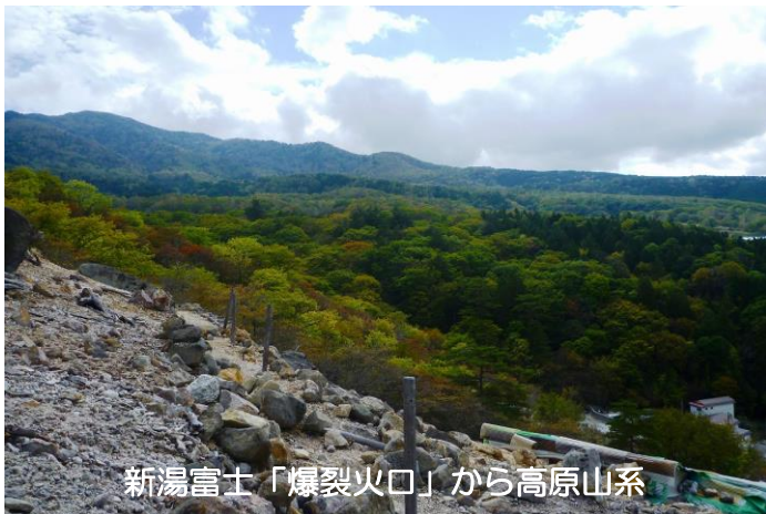
新湯富士「爆裂火口」から高原山系