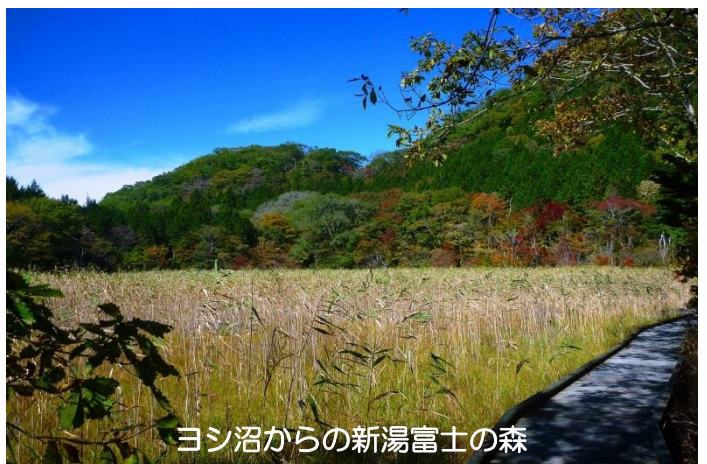
ヨシ沼からの新湯富士の森