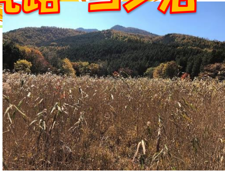
ヨシ沼から望む前黒山山麓