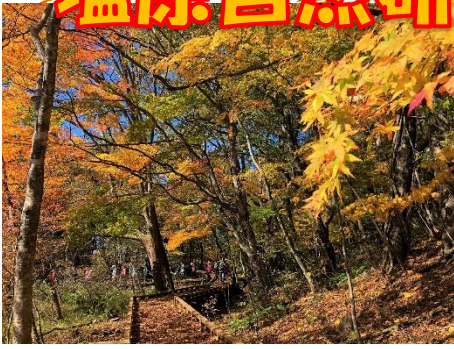
ヨシ沼の木道より