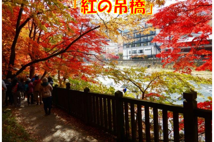
吊橋からの溪谷を堪能して、紅葉の森の中を観る！見る！