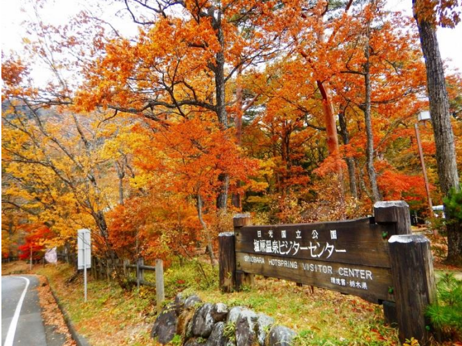
紅葉に染まるビジターセンター前山国営林