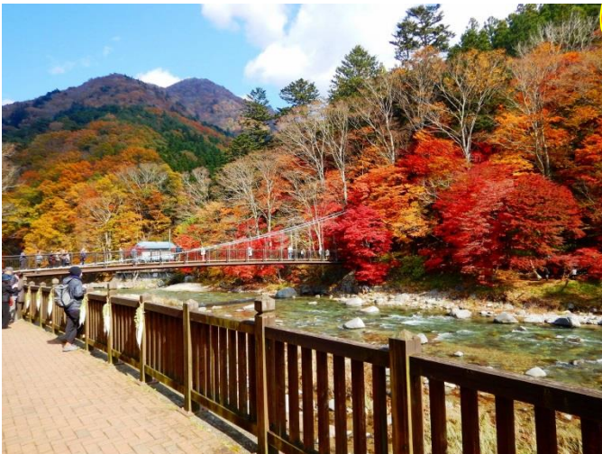
箒川沿いの遊歩道から紅葉の森を観る！見る！