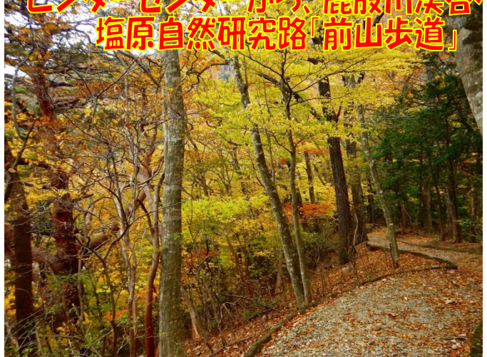
紅葉を森の中から観る！見る！ 前山歩道