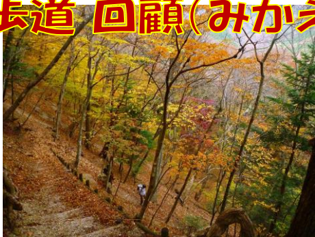
カエデ類の紅葉を堪能！