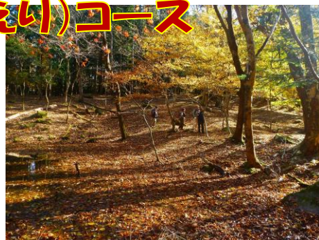
晩秋の森に包まれる遊歩道