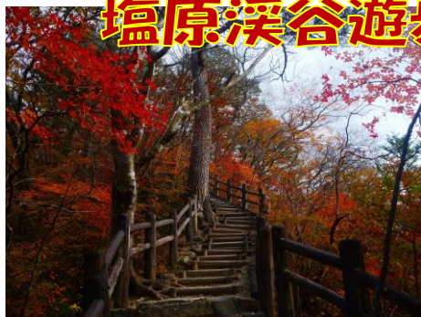
ツツジ類の紅葉を堪能！