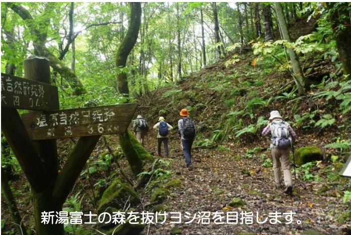
新湯富士の森を抜けヨシ沼を目指します。