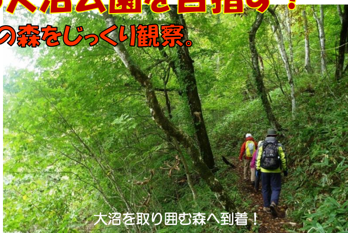
大沼を取り囲む森へ到着！