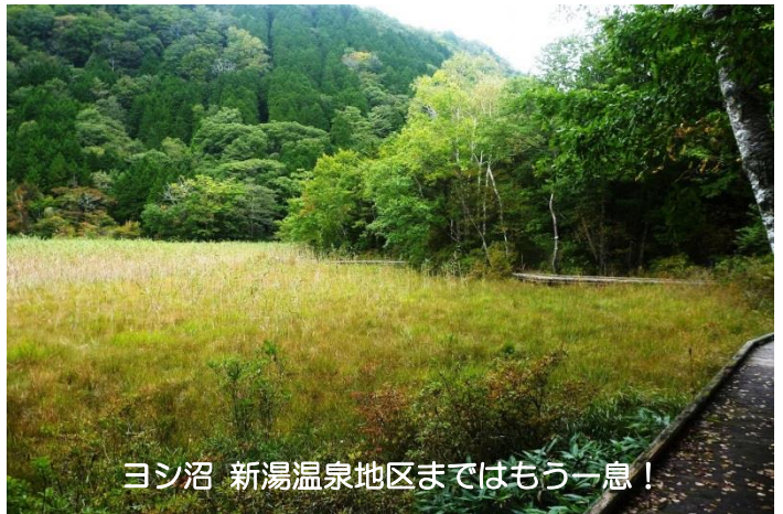
ヨシ沼 新湯温泉地区まではもう一息！