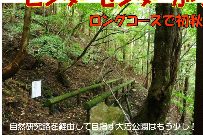
自然研究路を經由して目指す大沼公園はもう少し！