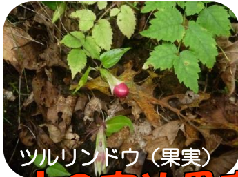
ツル lindウ (果実)