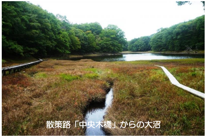
散策路「中央木橋」からの大沼