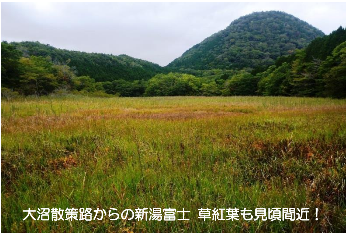
大沼散策路からの新湯富士 草紅葉も見頃間近！