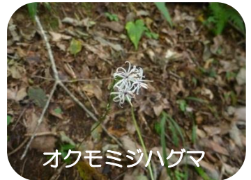
オクモミジハグマ