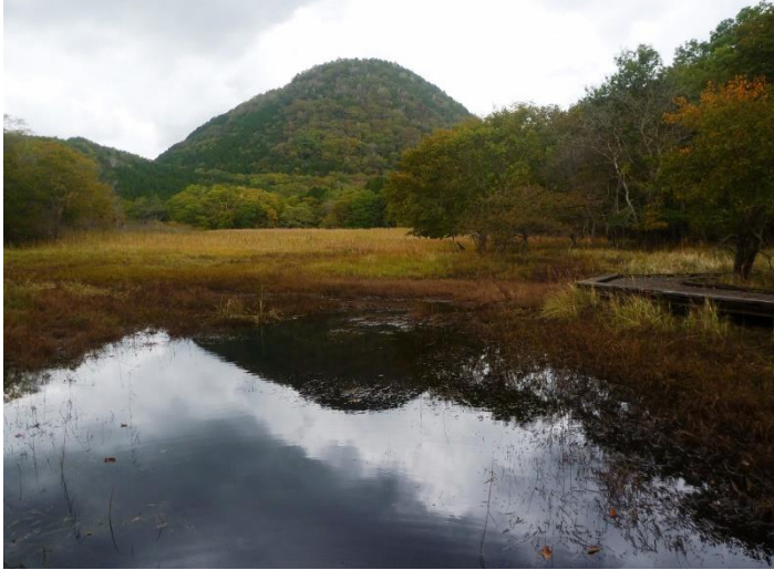
草紅葉が進む、大沼からの新湯富士