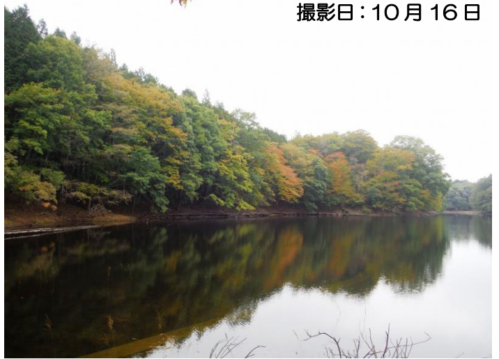
大沼周回コース上からの大沼