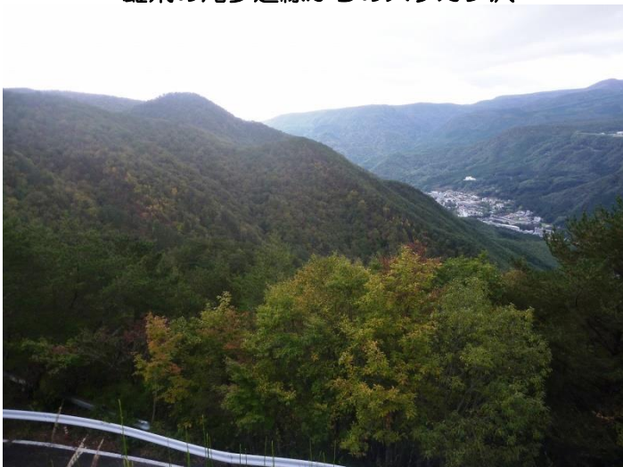
紅葉が進む、塩那スカイラインからの温泉街