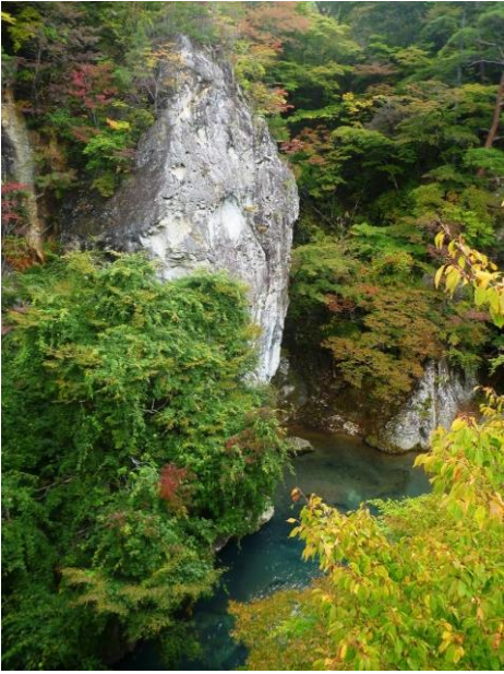
鹿股川：鹿股橋より（10/19）