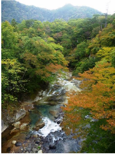
鹿股川：四季の里橋より（10/19）