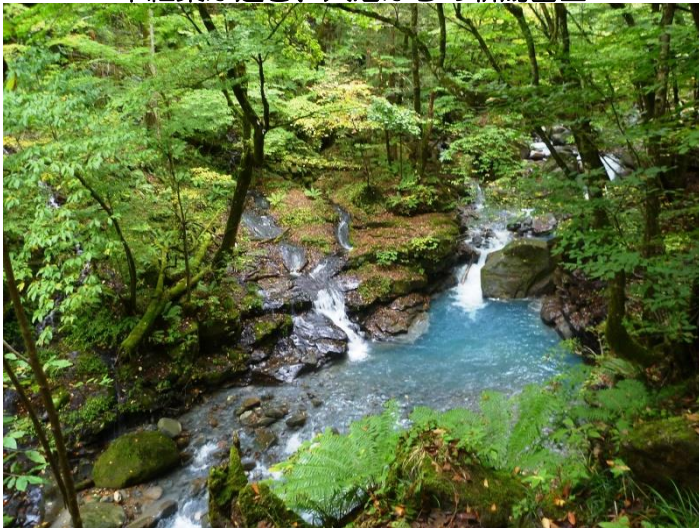
雄飛の滝歩道線からのスッカン沢