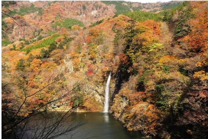
塩原溪谷遊歩道回顧コース「回顧の滝観瀑台」からの 箒川溪谷と回顧の滝。その上には、大正浪漫街道が見えます。

標高差のある塩原温泉郷の紅葉狩りは、多種多様な秋の森を同時に楽しむことができます。 秋の森の一期一会・・・どうぞ堪能ください。