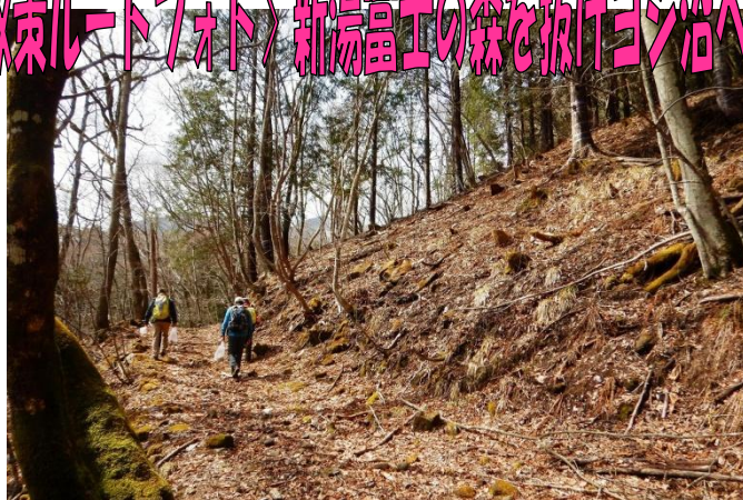
大沼駐車場から新湯富士の森を抜け、ヨシ沼を目指します。