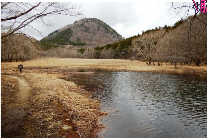
散策路「中央木橋」付近からの新湯富士