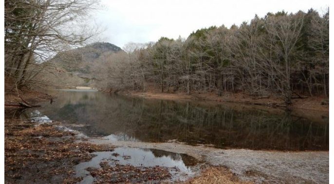
周回散策路。少し増水気味の大沼は、芽吹き前の森に包まれています。