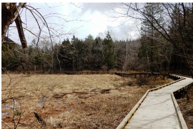
ヨシ沼周回散策路