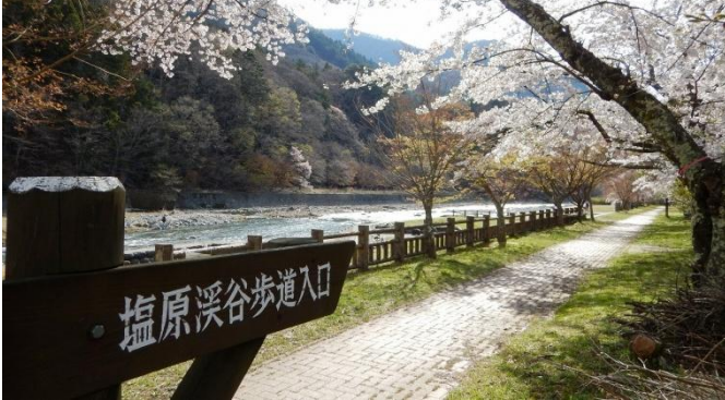
温泉街中心街の箒川沿いに延びる「塩原渓谷遊歩道」。さくらの花咲くお気に入りの景観を探してみては？