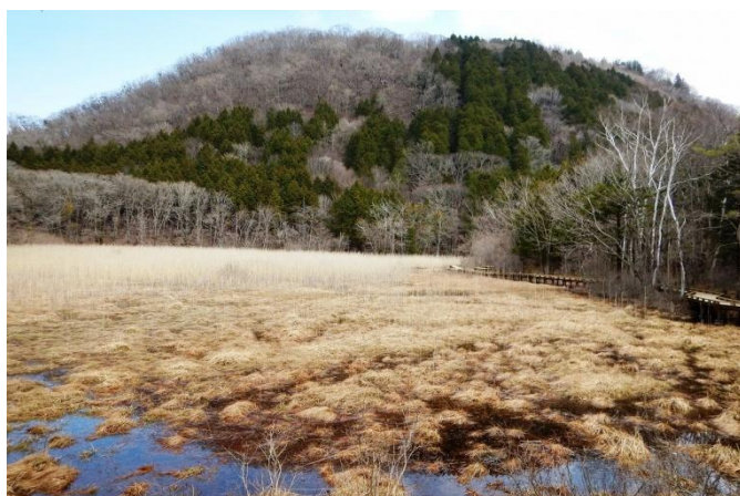
ヨシ沼からみる新湯富士