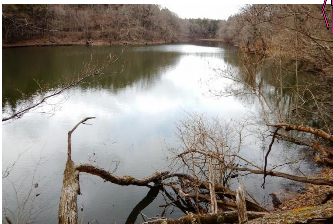
周回散策路からの大沼