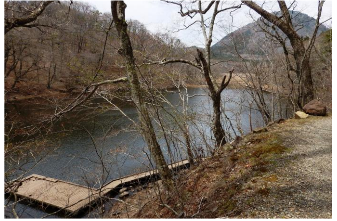
周回コースでは、大沼を見下ろせる場所もあります