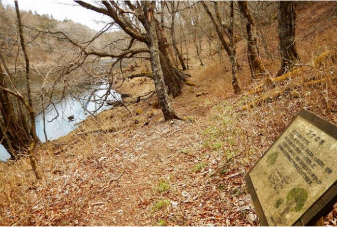
ブナやミズナラの巨木が点在する周回散策路の森