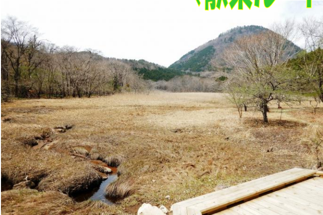
散策路中央デッキ付近からみる新湯富士