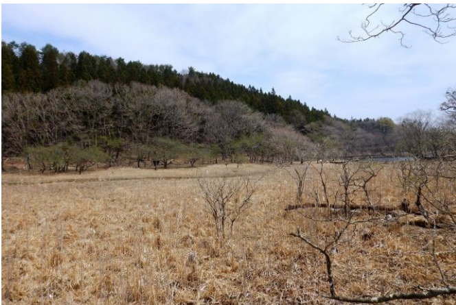
木道散策路からの湿原エリアの様子