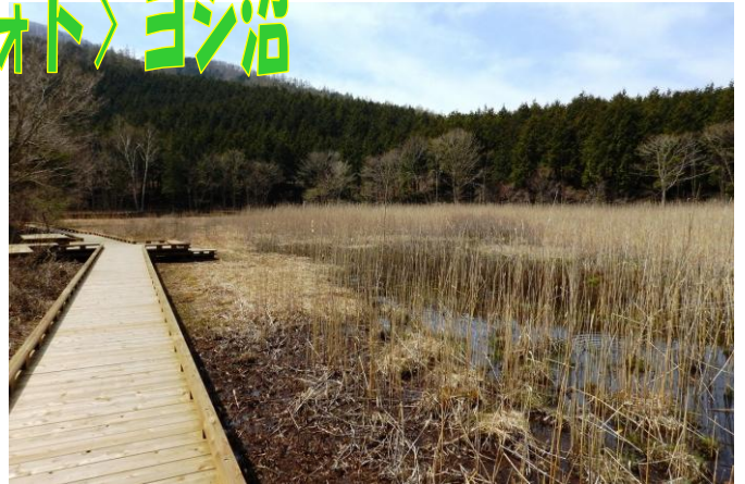
ヨシ沼周回散策路の湿原の様子