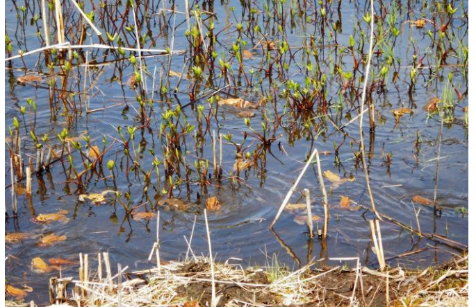
始まりました！アズマヒキガエルのカエル合戦！