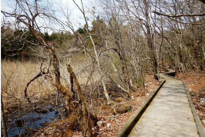
アズマヒキガエルの鳴き声が響く、足音も聞こえる散策路