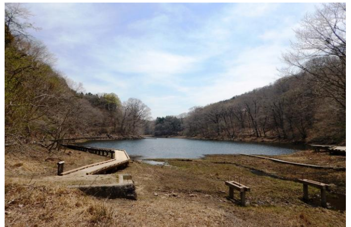
この大沼をゆっくり周回コースで散策してください。 「中央木橋」付近からみる大沼の様子