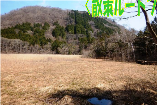
ヨシ沼からみる新潟富士