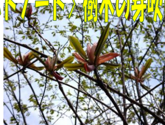
ホオノキの芽吹き