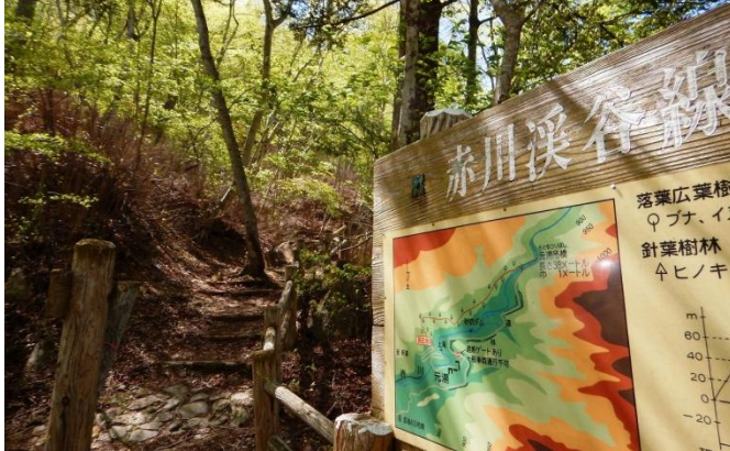
赤川渓谷遊歩道入口。往復散策となる遊歩道です。