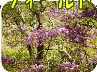
トウゴクミツバツツジ