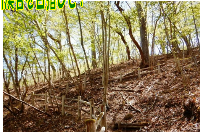
起伏に富んだルートは、森の樹木をじっくり観察できます！