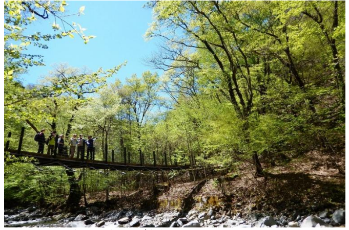
吊橋からの溪谷景観を堪能。ルート上ここから先の森も見どころが満載！