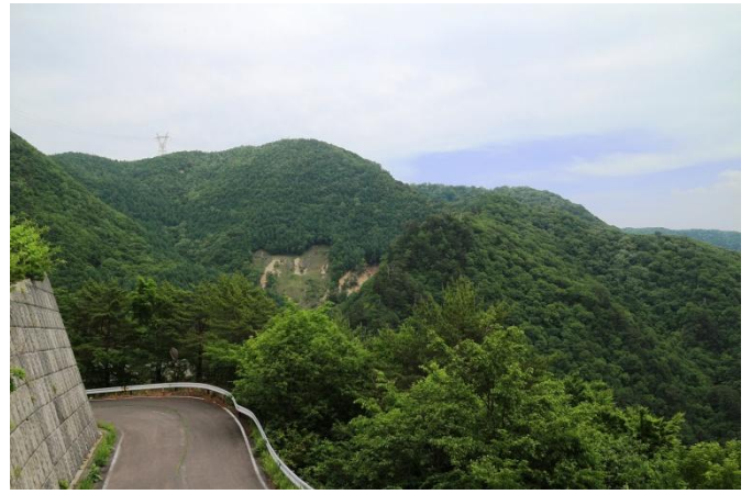
塩那スカイラインからの眺望