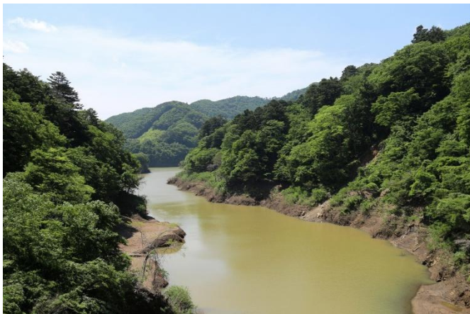
回顧の吊橋からの箒川溪谷下流