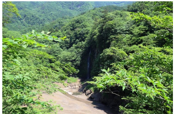
回顧の滝観瀑台からの「回顧の滝」と箒川溪谷