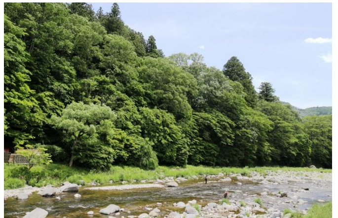
「紅の吊橋」架かる、箒川渓谷 (古町温泉地区)