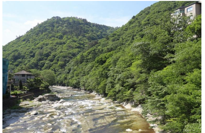
渓谷遊歩道やしおコースのルートでもある、福渡橋からの箒川渓谷 上流・下流