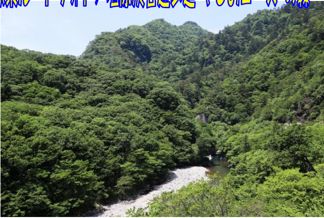
やしおコース箒川ダム園地からの箒川渓谷