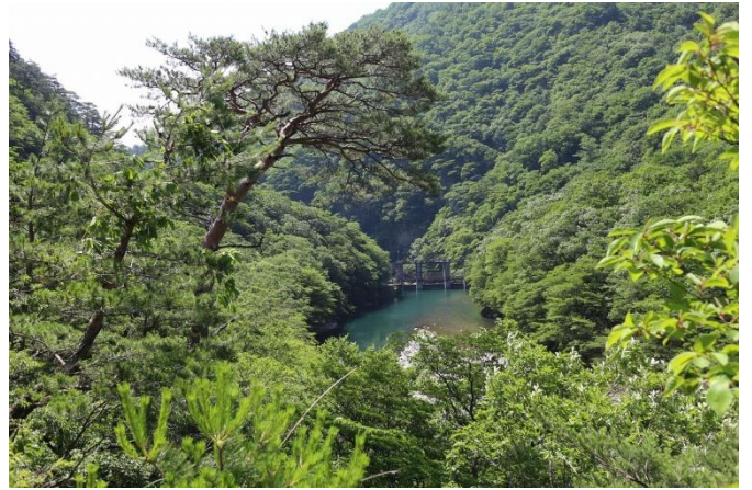
国道 400 号せんからの箒川ダムと渓谷の森