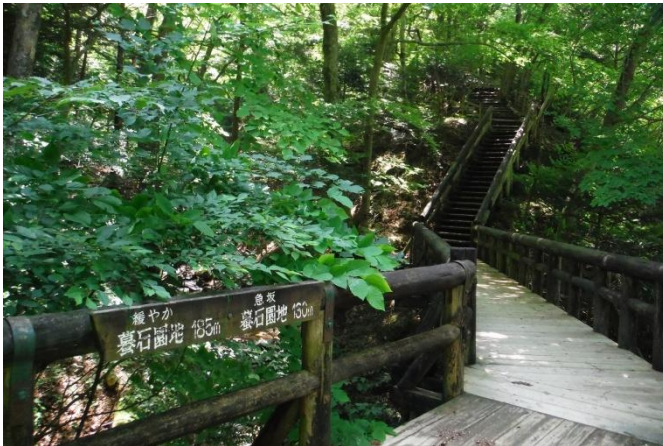
溪谷遊歩道回顧のコース散策路

「回顧の滝観瀑台」分岐から「留春の滝駐車場(猿岩トンネル駐車場)」区間。期間：令和3年5月末まで