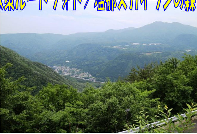
「展望広場」からの眺望。温泉街と高原山