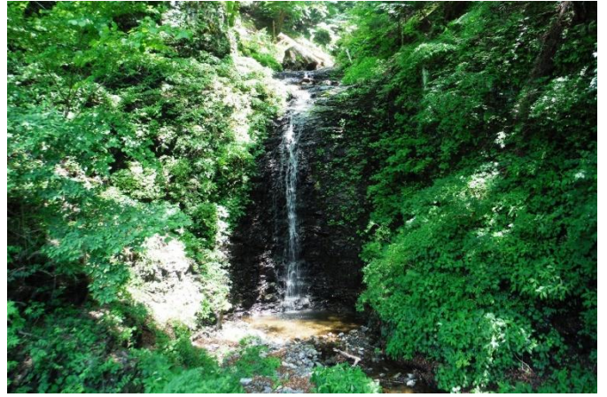
大正浪漫街道にある「仙髻 (せんぜん) の滝」