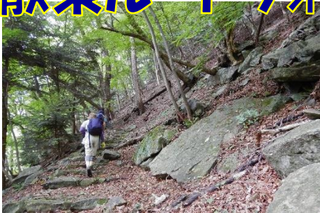
大網園地から箒川ダム園地を目指す