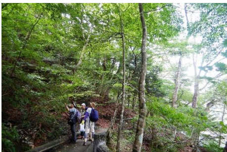
じっくり森を観察しながら・・・。