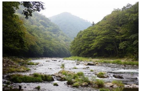
箒川のせせらぎをききながら休憩もおすすめ！