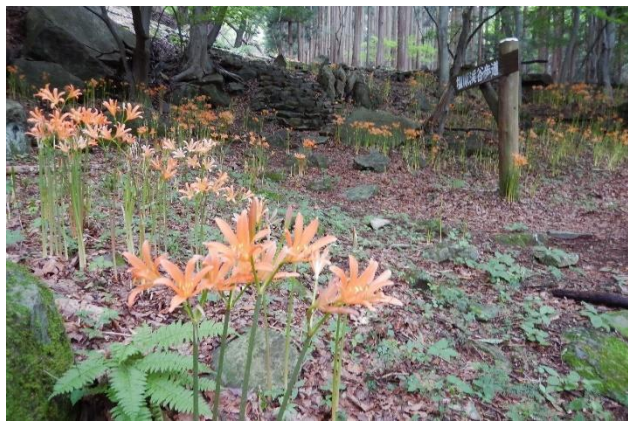
キツネノカミソリの花咲く散策路 (大網園地)