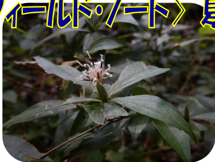
ナガバノコウヤボウキ