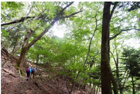
箒川溪谷の森を抜け、ビジターセンターを目指す！