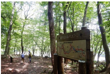
福渡怨念地区の散策路。ビジターセンターはもう少し！