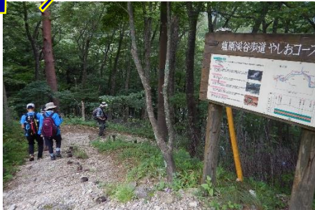
箒川ダム園地から溪谷の森へ！