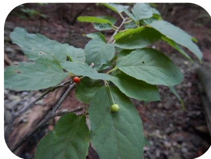
フウリンウメモドキ (果実)