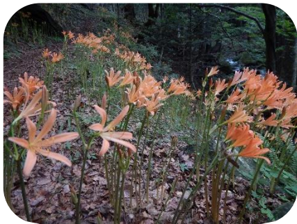
キツネノカミソリ (大網園地)