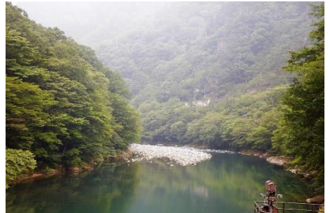
箒川ダムからの溪谷景観