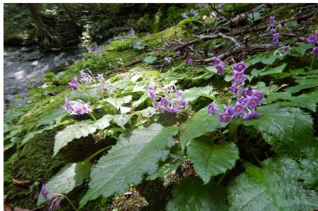
イワタバコの花咲く散策路 (琵琶が沢付近その他)