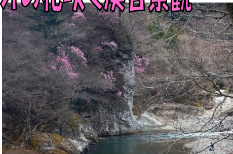
やしおコース「錦帯岩」