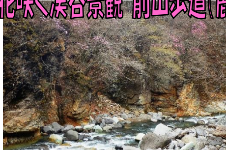
吊橋からの鹿股川溪谷