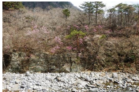
Sビジター対岸「七ッ岩吊橋」からの 箒川溪谷 アカヤシオの群生地