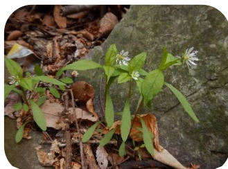
ヒゲネワチガイソウ