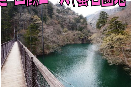
「回顧の吊橋」からの箒川溪谷