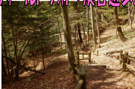
墓石園地駐車場から溪谷の森へ下ります