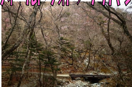
溪谷歩道やしおコース随一のアカヤシオの群生地 「琵琶が沢」