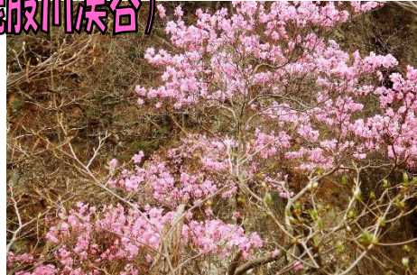
アカヤシオの花が身近に堪能できます。