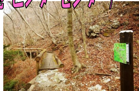
箒川に沿って延びる散策路