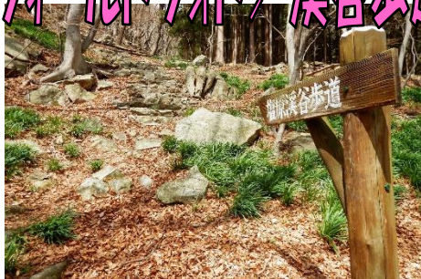
大網園地からSビジターを目指す！