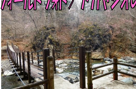
「仙人岩吊橋」とアカヤシオ咲く溪谷