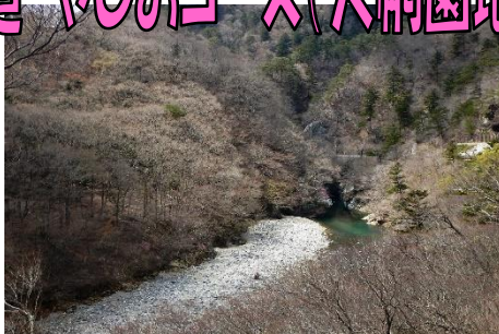
箒川ダム園地からの箒川溪谷