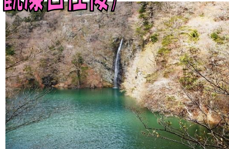
散策路観瀑台からの「回顧の滝」