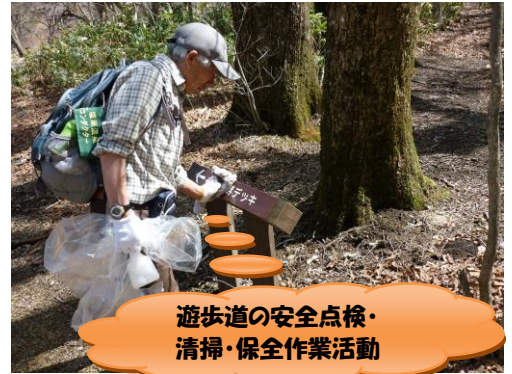
遊歩道の安全点検・清掃・保全作業活動