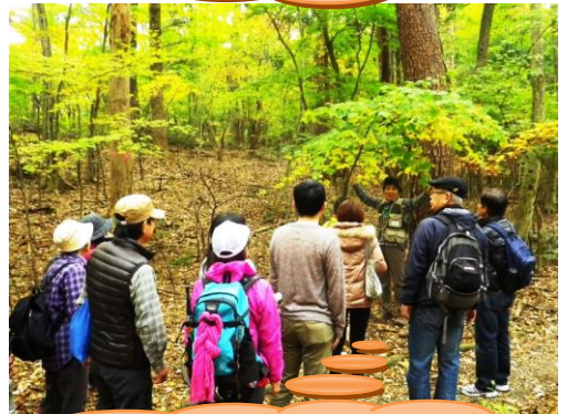
ビジターセンターの年間事業をはじめとする自然解説(ガイド)活動