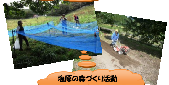
塩原の森づくり活動 その他森林活用活動