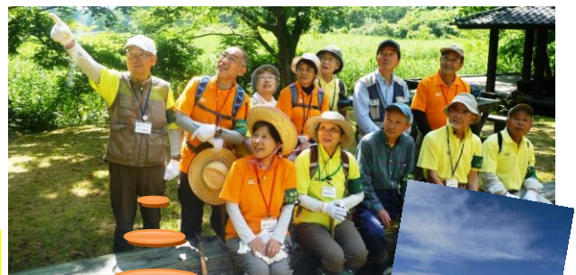
私たちと一緒に塩原の自然・四季を楽しみましょう！