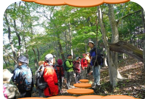
ビジターセンターの年間事業をはじめとする自然解説(ガイド)活動