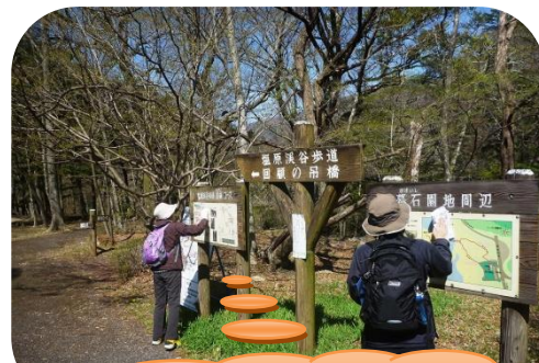
自然公園(遊歩道)の安全点検・清掃・保全作業活動