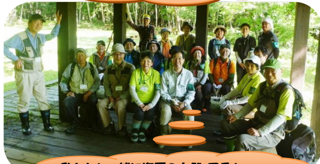
私たちと一緒に塩原の自然・四季を学び楽しみ、伝えてゆきましょう。