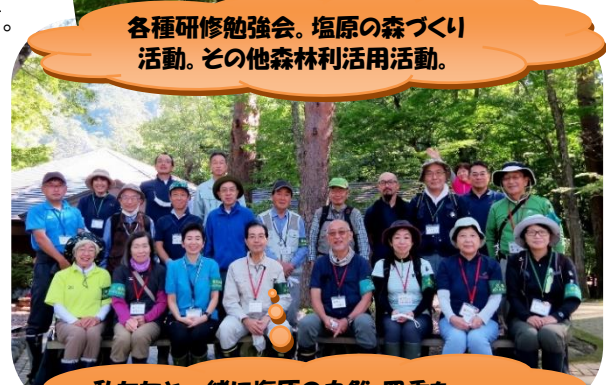
私たちと一緒に塩原の自然・四季を学び楽しみ、伝えてゆきましょう。