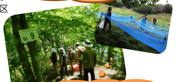
各種研修勉強会。塩原の森づくり活動。その他森林利活用活動。