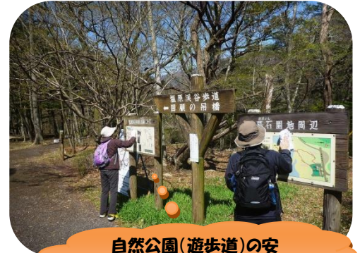
自然公園(遊歩道)の安全点検・清掃・保全作業