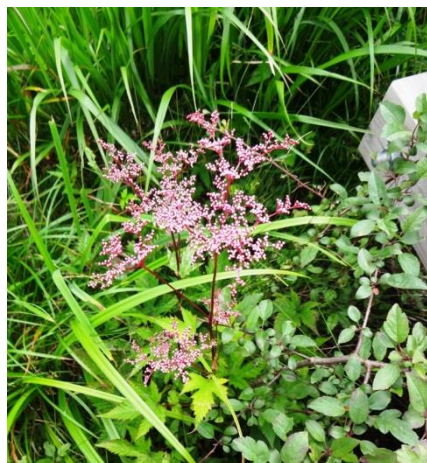
アカバナシモツケソウ