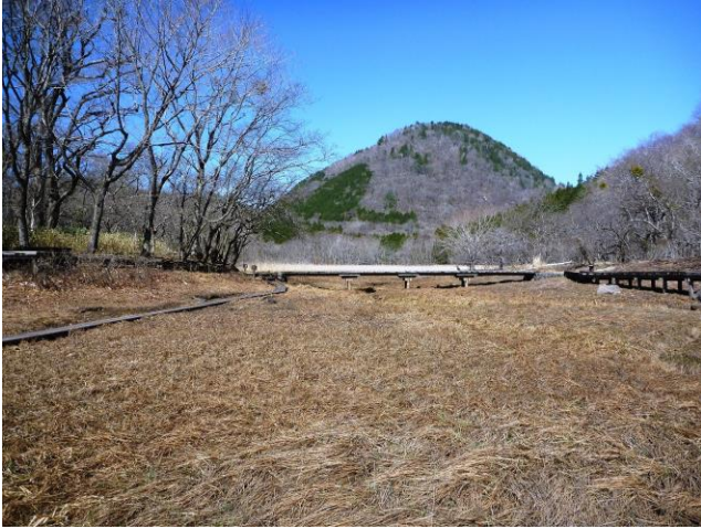
大沼から新湯富士を望む