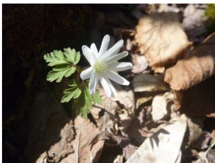
キクザキイチゲ（白花）