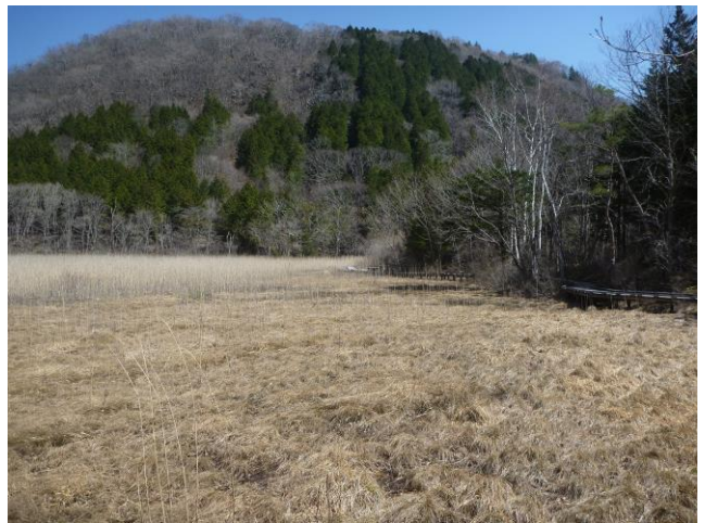
ヨシ沼の木道から新湯富士を望む