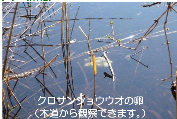
クロサンショウウオの卵 (木道から観察できます。)