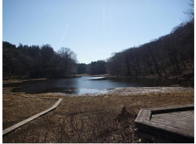
雪解けの森に囲まれる大沼