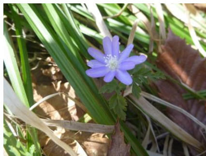
キクザキイチゲ（紫花）