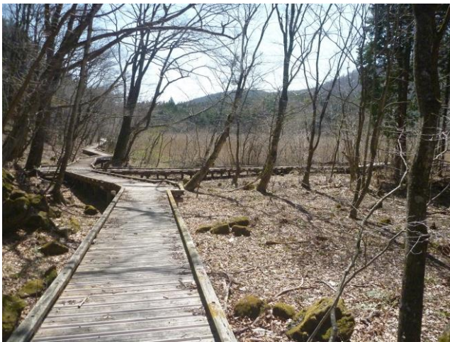
ヨシ沼駐車場からヨシ沼を目指す