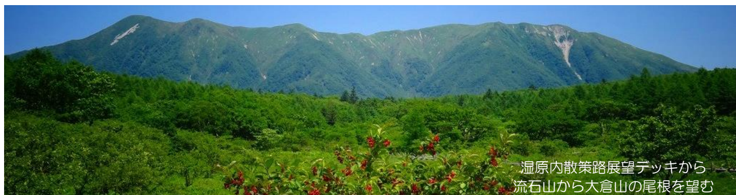
湿原内散策路展望デッキから 流石山から大倉山の尾根を望む