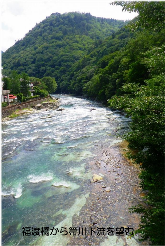
福渡橋から箒川下流を望む