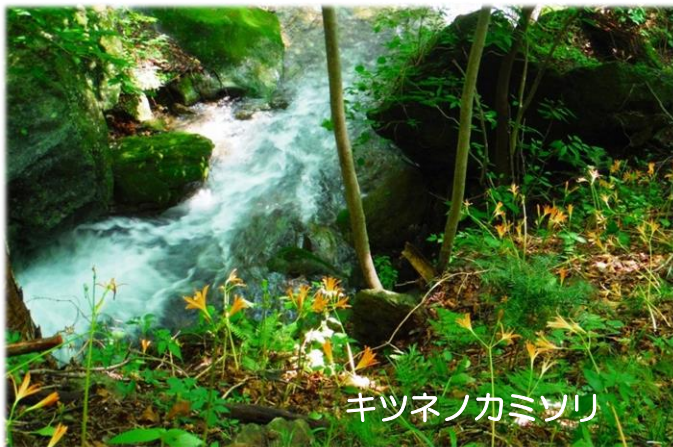
キツネノカミソリ