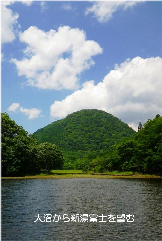
大沼から新湯富士を望む