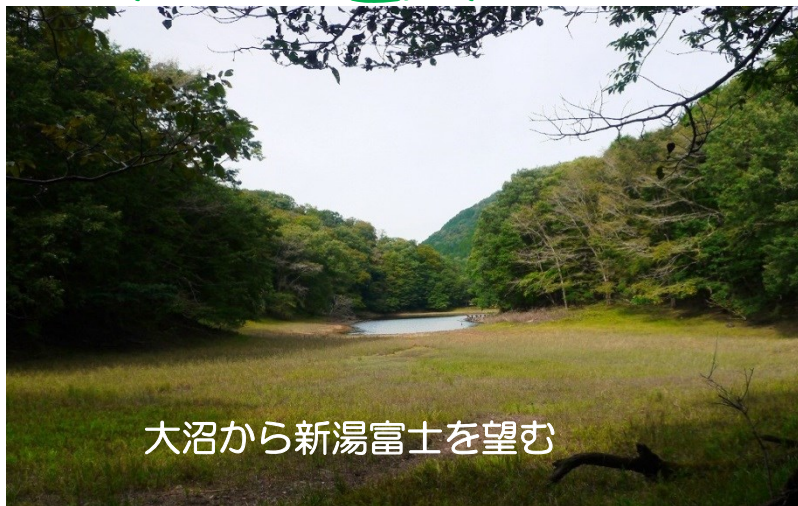
大沼から新湯富士を望む