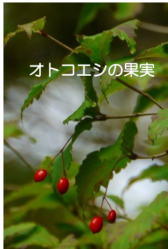
オトコエシの果実