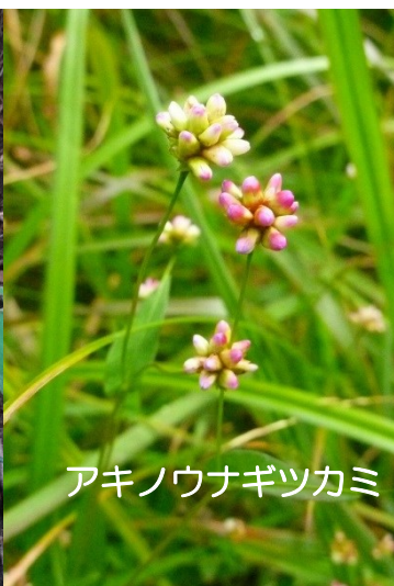
アキノウナギツカミ