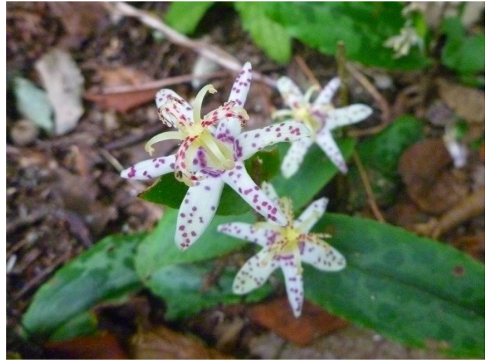
ヤマジノホトトギス