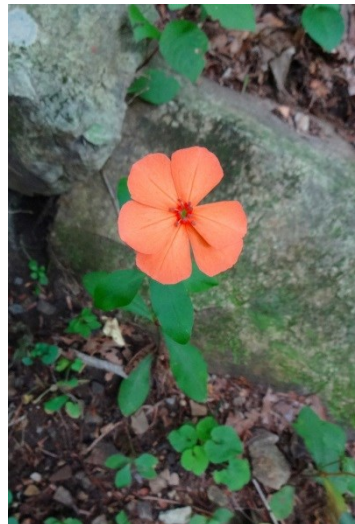
フシグロセンノウ