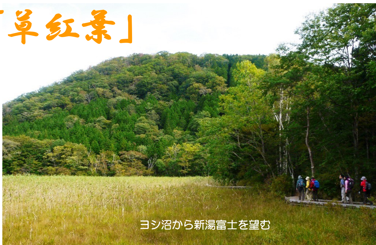
ヨシ沼から新湯富士を望む