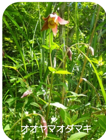
オオヤマオダマキ