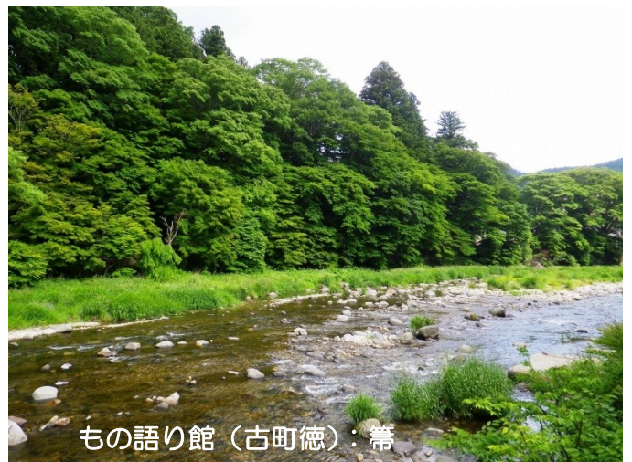
もの語り館（古町徳）：箒