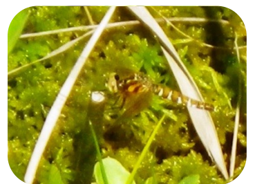
ハッチョウトンボ♀