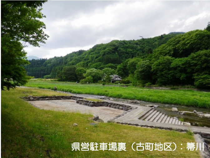
県営駐車場裏（古町地区）：箒川