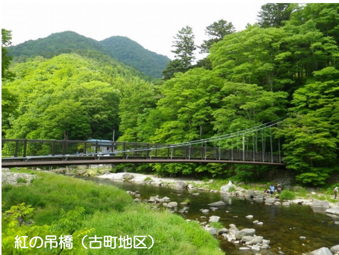
紅の吊橋（古町地区）