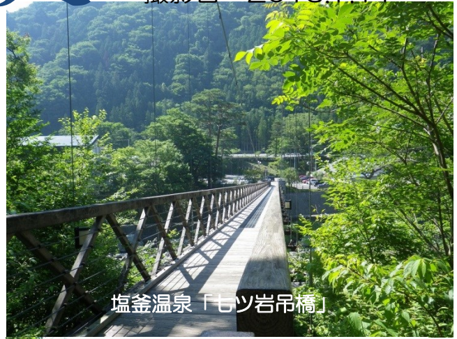
塩釜温泉「モツ岩吊橋」