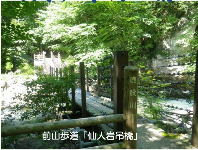
前山歩道「仙人岩吊橋」