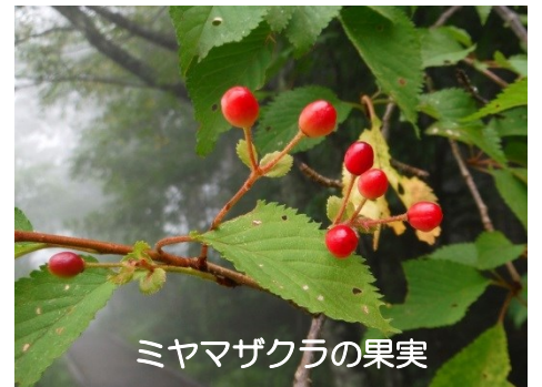
ミヤマザクラの果実