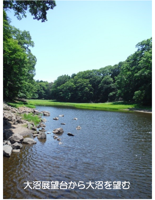
大沼展望台から大沼を望む