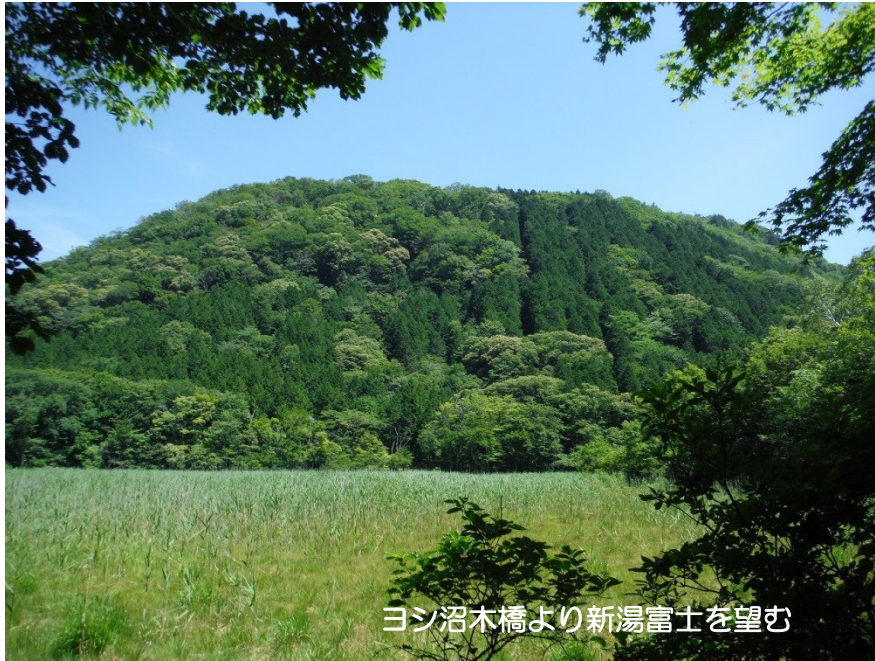
ヨシ沼木橋より新湯富士を望む