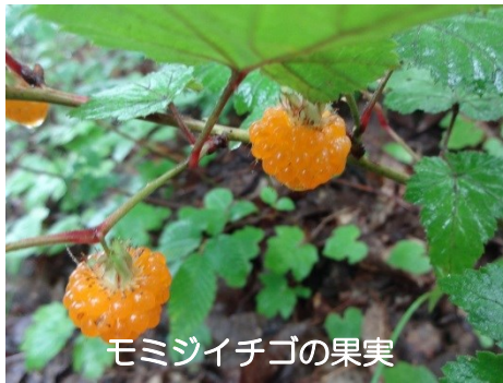
モミジイチゴの果実