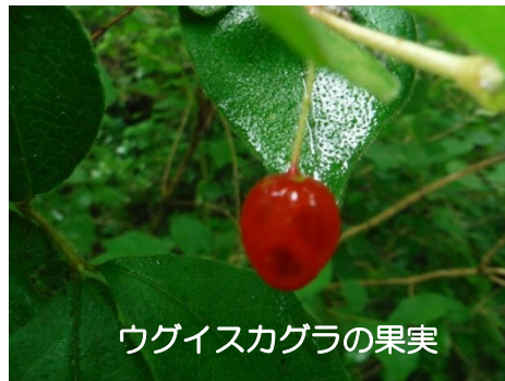
ウグイスカグラの果実