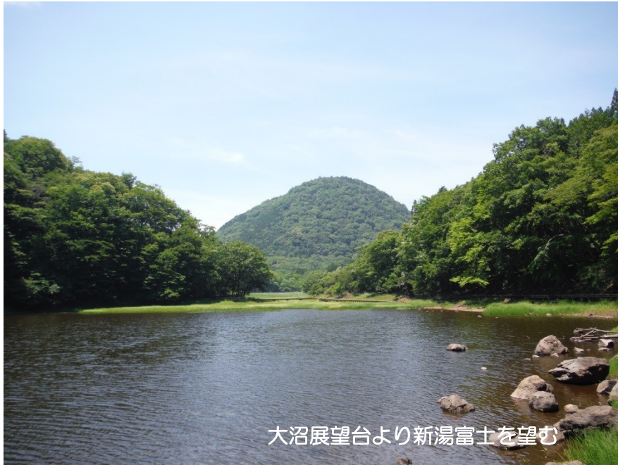
大沼展望台より新湯富士を望む