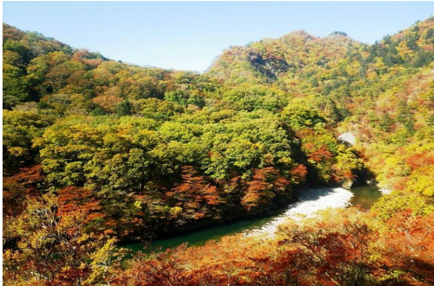
塩原溪谷湯歩道やしおコース「碓氷ダム園地」からの眺望

◆ 碓氷川溪谷沿いから色付き始める、「溪谷の紅葉前線」分かりますか？ 塩原溪谷遊歩道や、国道 400 号線で碓氷川をかさのぼり・・・錦秋の森・温泉郷を目指す！