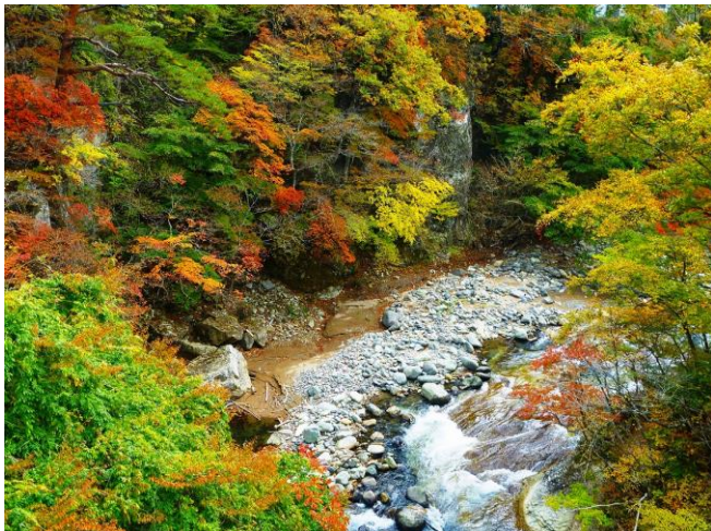
鹿股川溪谷「鹿股橋」から。

遊歩道や吊橋を経由して、溪谷の森や温泉街で「紅葉狩り」。きっとお気に入りのポイントがあるはずです。