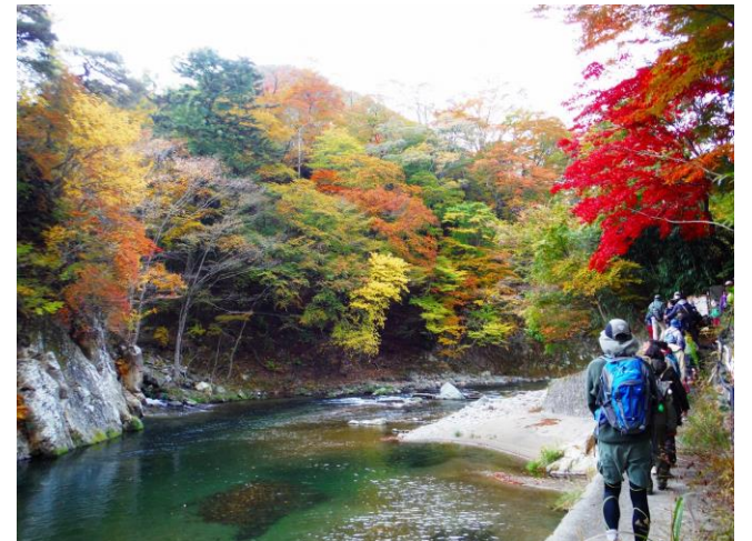
碓氷川溪谷をさかのぼり温泉街へ。「塩脇橋」 (塩釜温泉地区) 付近。