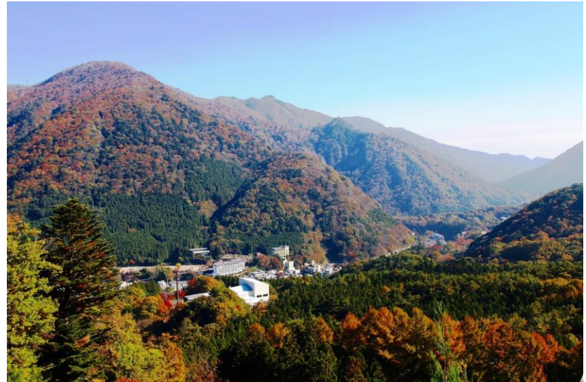
もみじの谷・・・温泉街を望む