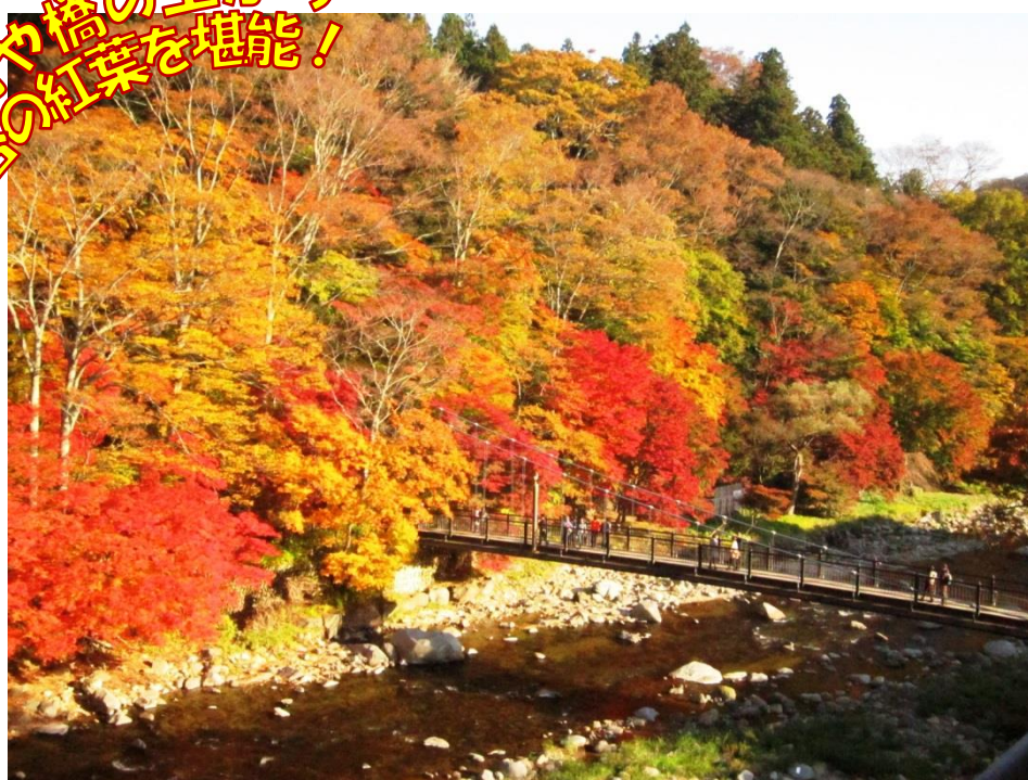
「紅の吊橋」(古町温泉地区)