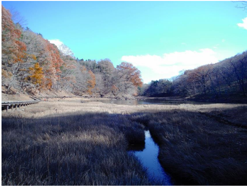
大沼散策路、中央木橋より大沼を望む。