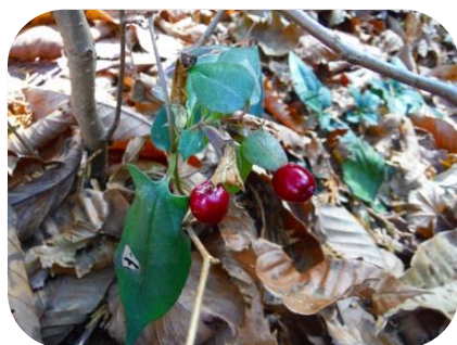
ツルリンドウ（果実）