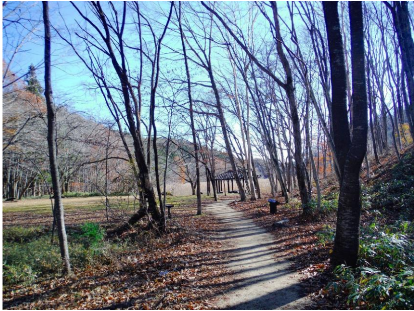
大沼公園駐車場から、森を抜け大沼を目指します。