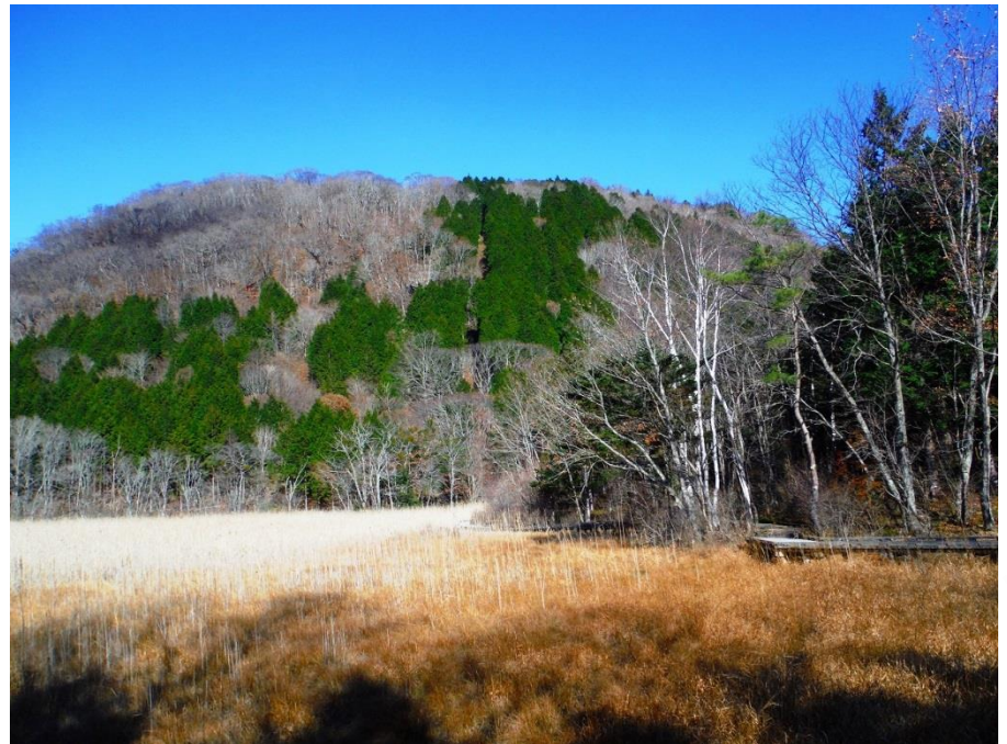
ヨシ沼散策路から新湯富士を望む。

◆この時期の森を散策する際は、暖かい服装で！一枚大目に、羽織るものをご持参して散策しましょう。