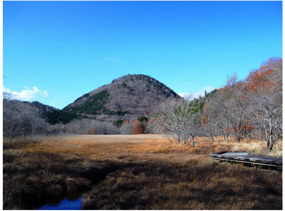
大沼散策路、中央木橋から「新湯富士」望む。