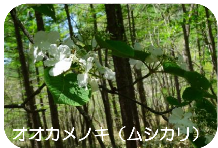
オオカメノキ（ムシカリ）