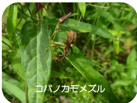
コバノカモメズル