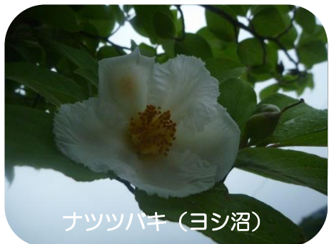
ナツツハキ (ヨシ沼)