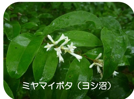
ミヤマイボタ (ヨシ沼)