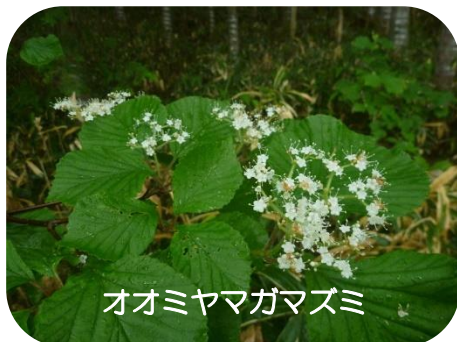
オオミヤマガズミ