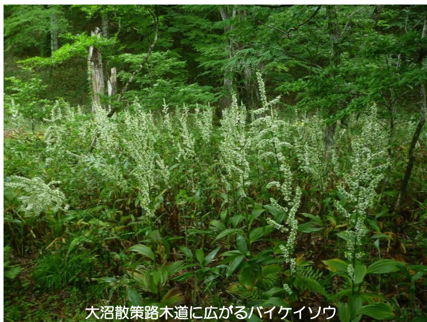
大沼散策路木道に広がるバイケイソウ