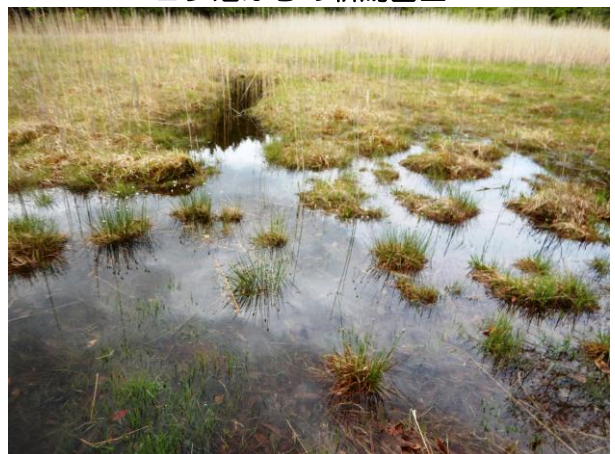
散策路デッキからのヨシ沼