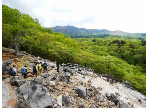
新湯温泉地区爆裂火口跡