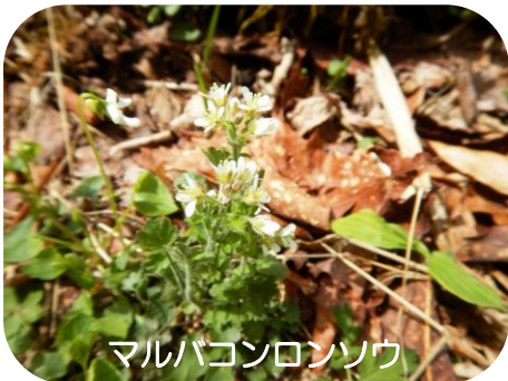
マルバコンロンソウ