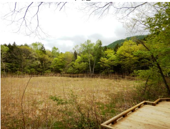
散策路でヨシ沼をゆっくり周回！