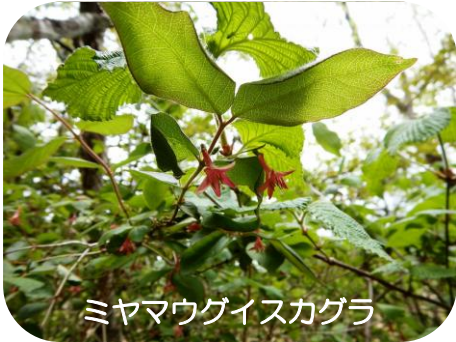
ミヤマウグイスカグラ