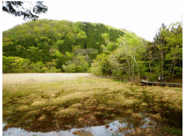
ヨシ沼からの新湯富士