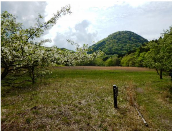
ズミの花咲く大沼からの新湯富士