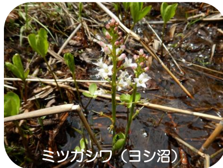
ミツガシワ (ヨシ沼)