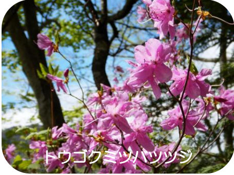
トウゴクミツハツツジ