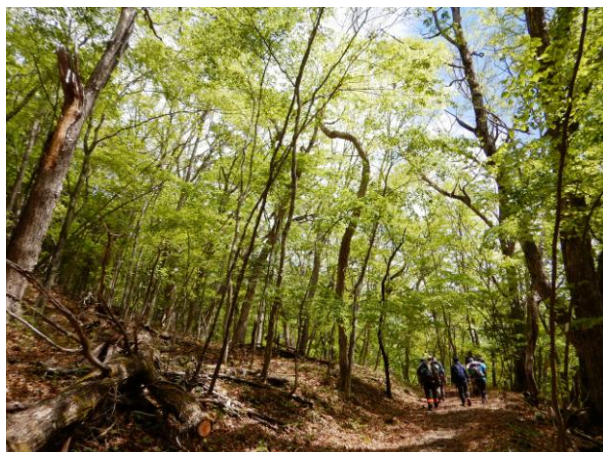
新湯富士の山頂をゆっくり目指す。

塩原自然研究路のシンボル「新湯富士」の森では、変化に富んだ新緑の森景観を堪能することができます。