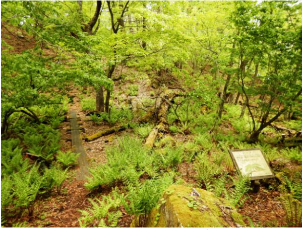
森の景観も変われば、 林床も変化に富んでいる