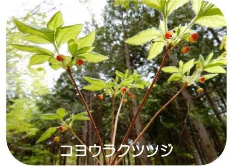
コヨウラクツツジ