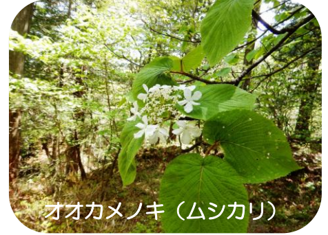
オオカメノキ (ムシカリ)