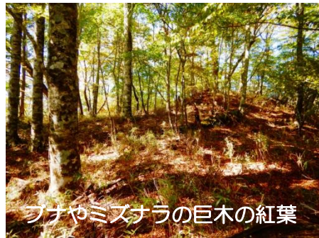
ブナやミズナラの巨木の紅葉