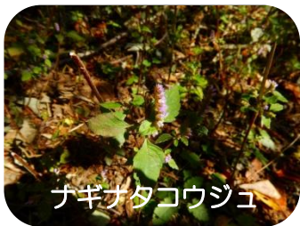
ナギナタコウジュ

秋の森を散策する際は暖かい服装で！一枚大目に羽織る、上着をご持参して散策しましょう。