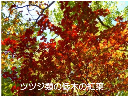
ツツジ類の低木の紅葉