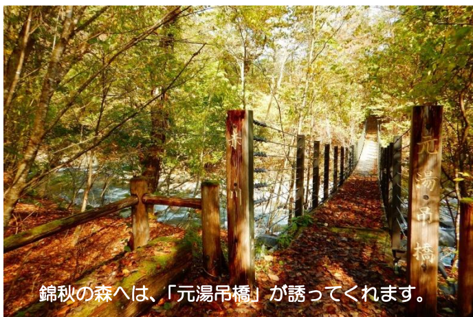
錦秋の森へは、「元湯吊橋」が誘ってくれます。