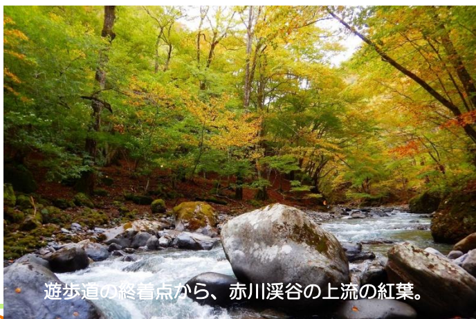
遊歩道の終着点から、赤川溪谷の上流の紅葉。