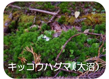
キッコウハグマ(大沼)