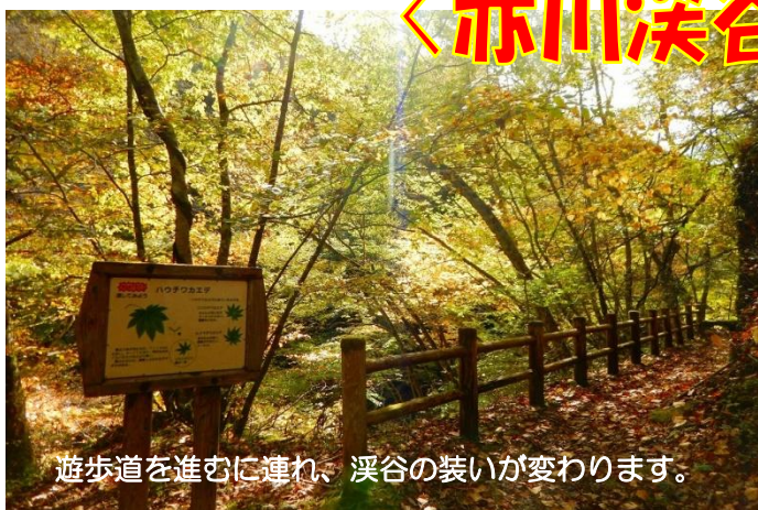
遊歩道を進むに連れ、溪谷の装いが変わります。