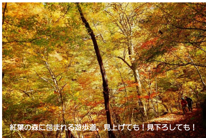
紅葉の森に包まれる遊歩道。見上げても！見下ろしても！