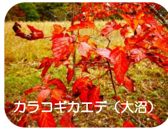
カラコギカエデ(大沼)