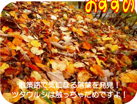
散策路で気になる落葉を発見！ツタウルシは触っちゃだめですよ！