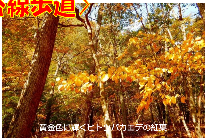
黄金色に輝くヒトツバカエデの紅葉