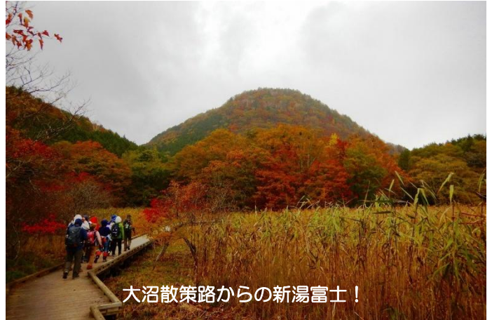
大沼散策路からの新湯富士！