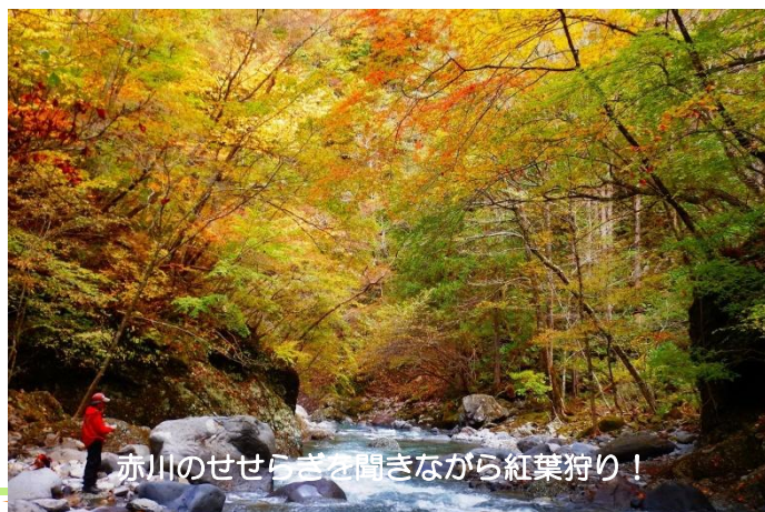
赤川のせせらぎを聞きながら紅葉狩り！