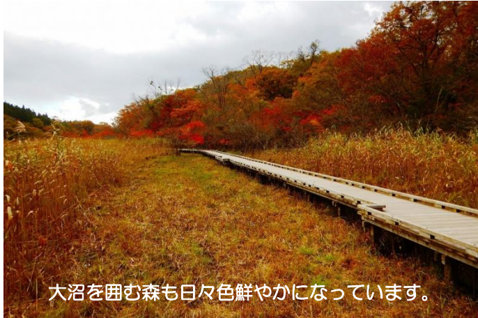
大沼を囲む森も日々色鮮やかになっています。