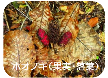
ホオノキ(果実・落葉)