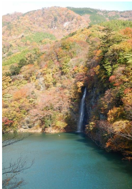
観瀑台から回顧の滝