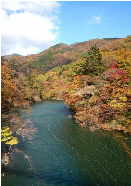
回顧の吊橋からの塩原ダム