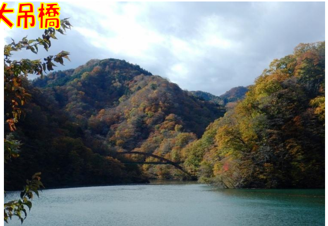
もみじ谷大吊橋からの風景