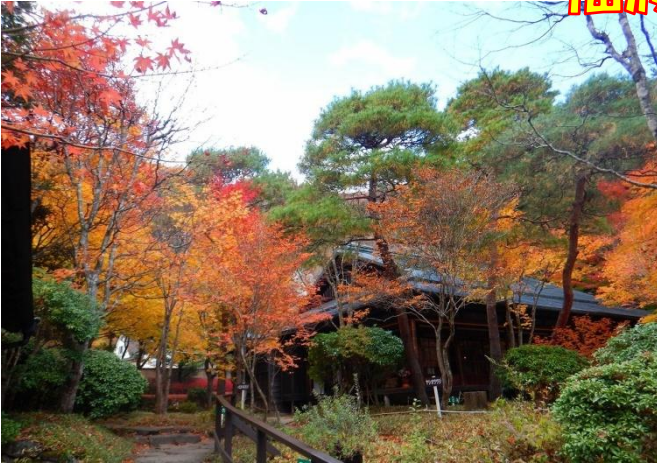
天皇の間記念公園