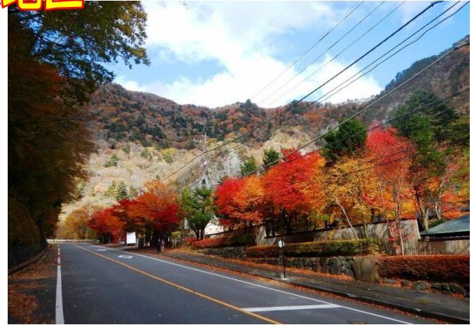
天皇の間記念公園国道 400 号沿い