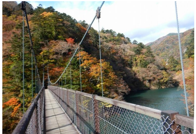
回顧の吊橋から紅葉