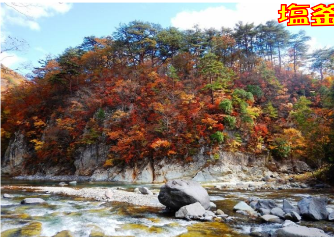
帯川と鹿股川の合流地点