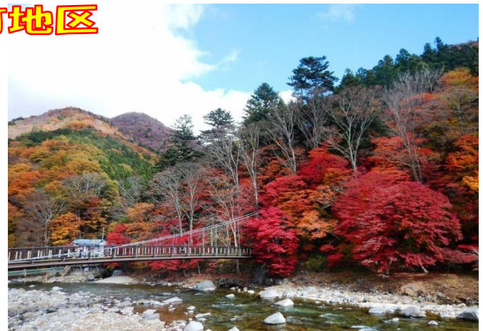
紅の吊橋：もの語り館

森の紅葉絵巻は、日々その姿を変えていきます。塩原温泉郷での「紅葉狩り」の参考にしてください。 自然公園利用マナーを守って楽しく「紅葉狩り」塩原温泉ビジターセンター