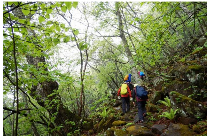
天候に関係なく滑りやすいので、ゆっくり慎重に山頂を目指します。立ち止まり森を観察するのを忘れなく！