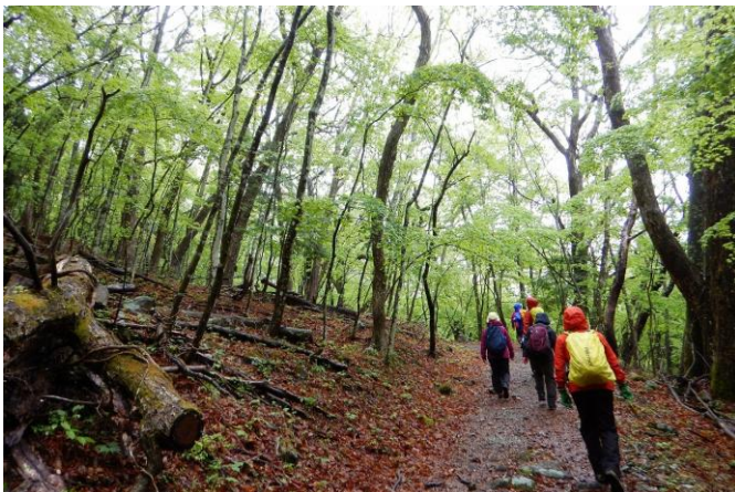
さあ、新湯富士の山頂をめざしてスタートです！

■新湯富士散策ルート登山は、大沼公園大沼駐車場を拠点にするのをお勧めします。大沼側から新湯富士山頂を目指し、ヨシ沼経由で周回。最後に、大沼から登頂した新湯富士の山様を見る！いかがでしょう。