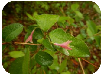
ミヤマウグイスカグラ