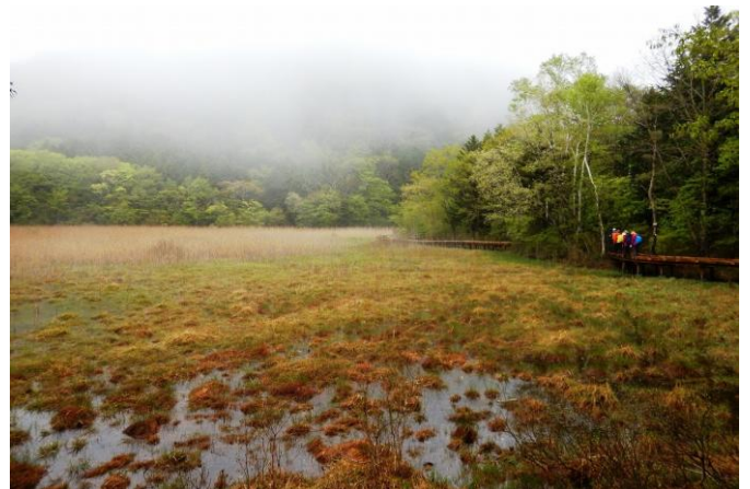
ヨシ沼周回散策路の湿原の様子