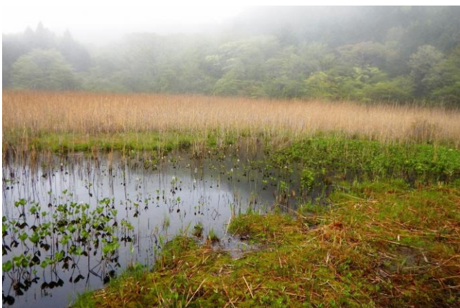
ミツガシワの花が見頃を迎えたよし沼の湿原