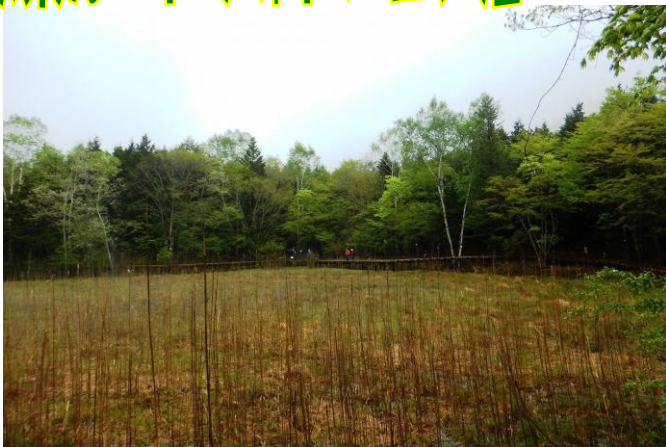
ヨシ沼周回散策路の様子

■ヨシ沼は、塩原エリアにおいて、ここでしか観察できない動植物の自生地、生息地となっています。現在見頃のミツガシワもそのひとつです。