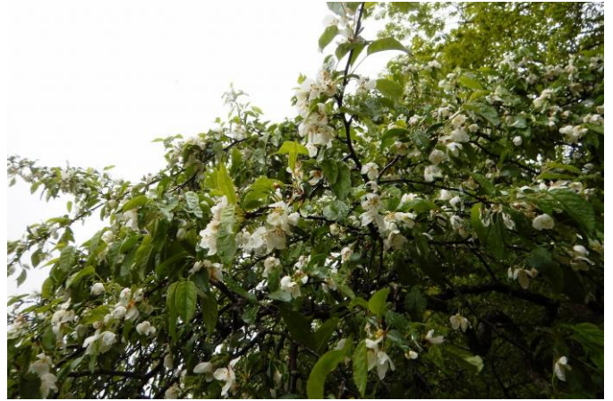
間もなく見頃を迎えるズミの花（拡大）