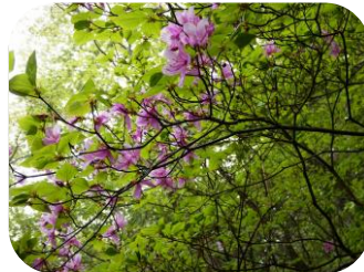
トウゴクミツバツツジ