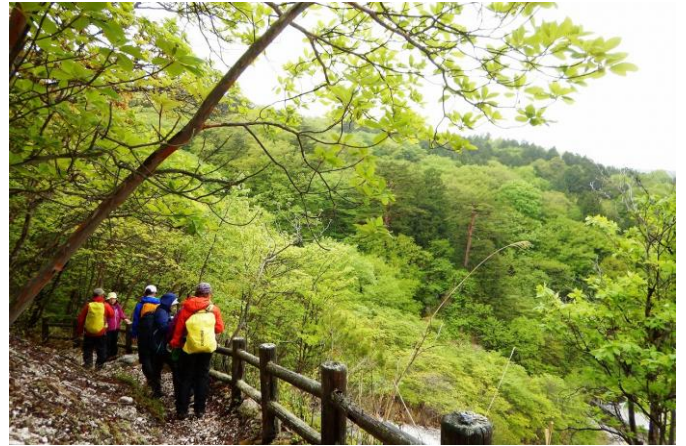
ヨシ沼を目指して新湯温泉地区を後にします。