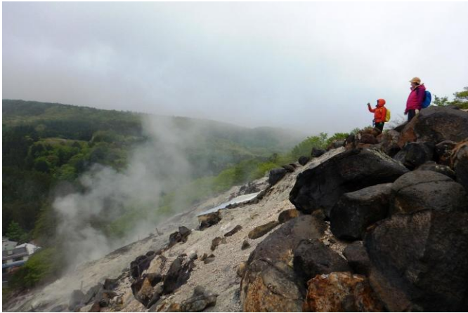
湯けむりただよ「爆裂火口跡」 散策路眼下に新湯温泉地区を一望できます。