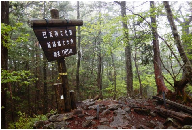
散策路 新湯富士山頂