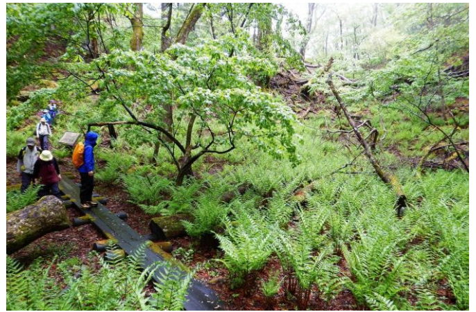
林床にはオシダも日々成長をとげていました。