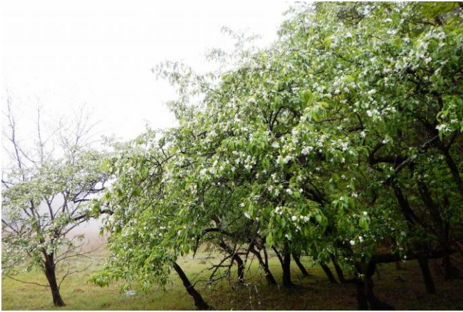
大沼エリアを白い花で囲むようになるズミ