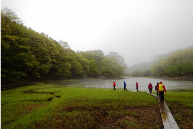
ガスに覆われ幻想的な大沼

■大沼は、塩原自然研究路のルート上において、多くのビュースポットが点在するエリアです。周回する散策路も整備されていますので、大沼だけをじっくり時間をかけて散策・観察するのもお勧めします！