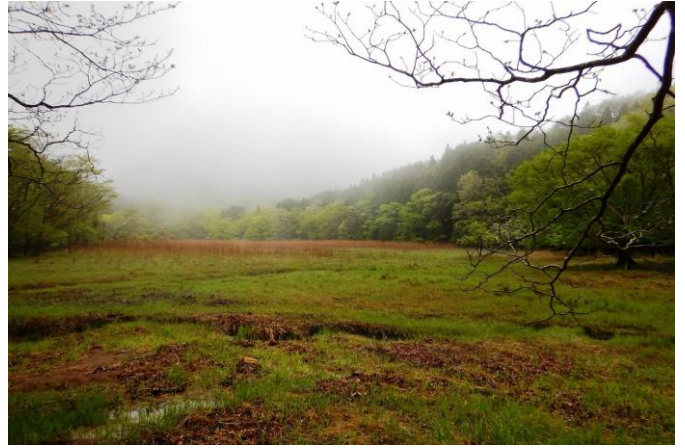
大沼湿原エリアと 撮影日はガスの中でした、新潟富士