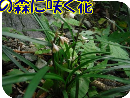
オオバジャノヒゲ