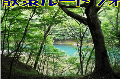
箒川ダムを横目に温泉郷を目指す！