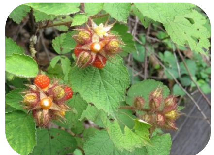
エビガライチゴ（果実）