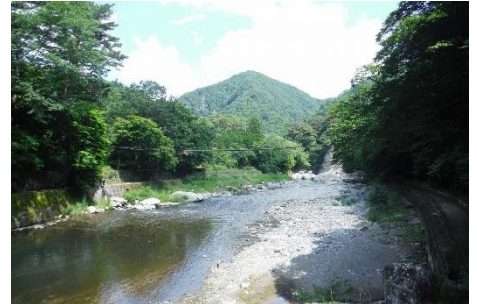
福渡温泉地区付近のやしおコース