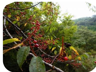
ウワミズザクラ(果実)