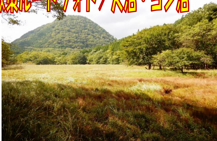
大沼からの新湯富士 草紅葉も日々進んでいます。