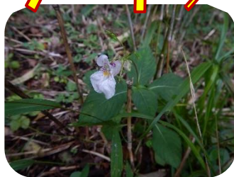
ツリフネソウ(白花)