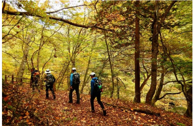
起伏に飛んだ溪谷の散策路では、変化に富んだ溪谷の森を堪能することができます。