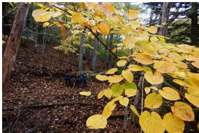
ヒトツバカエデの紅葉が抜群！目線上で堪能できます。

「元湯吊橋が」を經由して散策路は更に上流へ！ 渓谷沿いから色付き始める紅葉前線を確認！