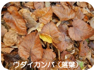
ウダイカンバ (落葉)