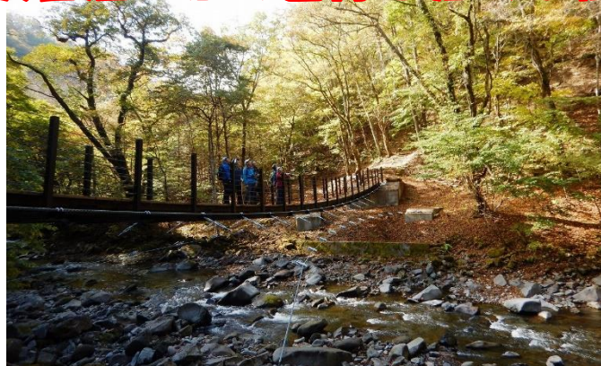
元湯吊橋が訪れる者を、渓谷の森のさらに上流へ誘ってくれます。渓谷のせせらぎと紅葉の森をじっくり堪能できます。

「元湯吊橋が」を經由して散策路は更に上流へ！ 渓谷沿いから色付き始める紅葉前線を確認！