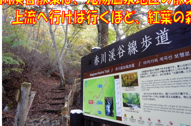
散策路の入口！ここから赤川上流を目指します。

赤川渓谷散策は、元湯温泉地区の散策路入口から往復散策で！ 上流へ行けば行くほど、紅葉の森が広がっています！