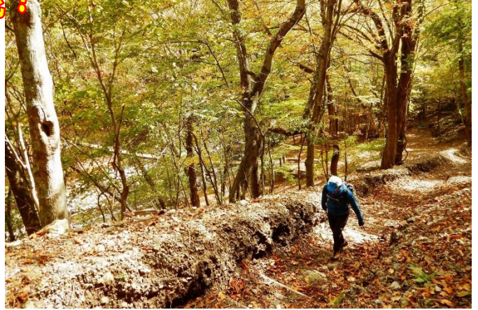
散策路・・・元湯吊橋からさらに上流は、紅葉がまさに絶好調でした！ のんびりさらに上流を目指します。