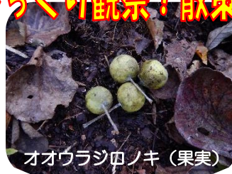
オオウラジロノキ (果実)