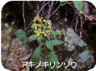
アキノキリンソウ