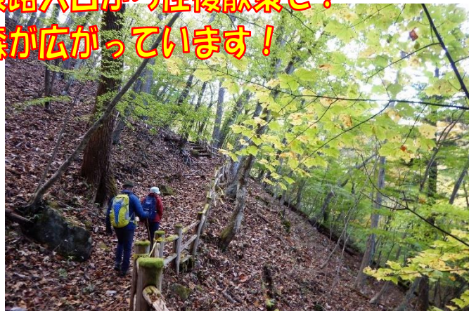
起伏に飛んだ散策路。森も色付きはじめています。