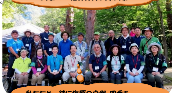
私たちと一緒に塩原の自然・四季を学び楽しみ、伝えてゆきましょう。