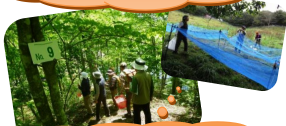
各種研修勉強会。塩原の森づくり活動。その他森林利活用活動。