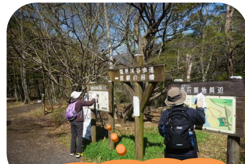
自然公園(遊歩道)の安全点検・清掃・保全作業