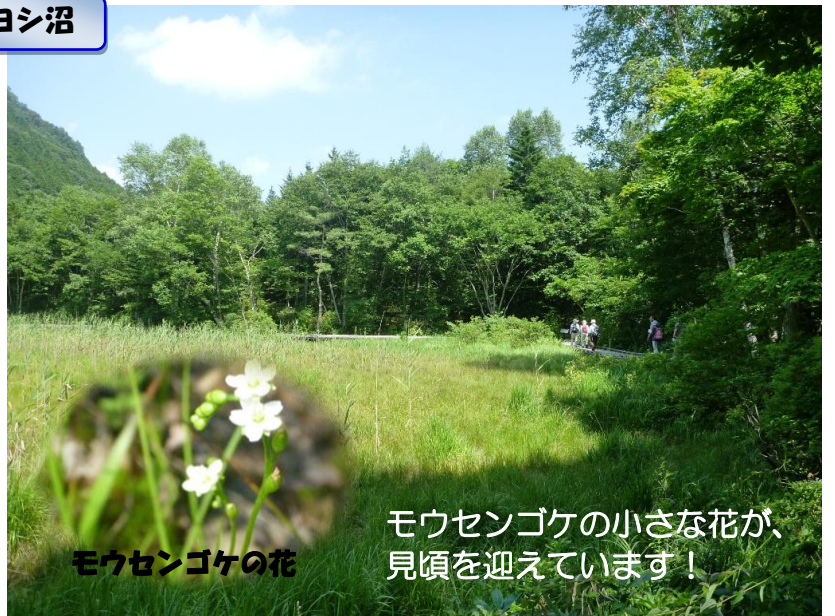
モウセンゴケの花