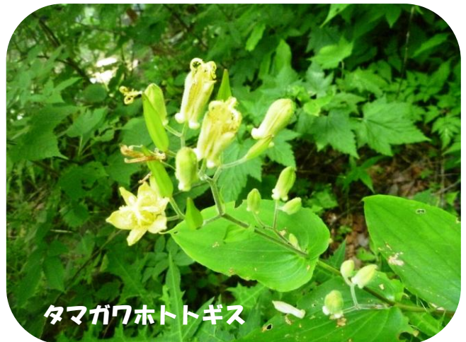
タマガワホトトギス