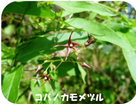
コバノカモメヅル