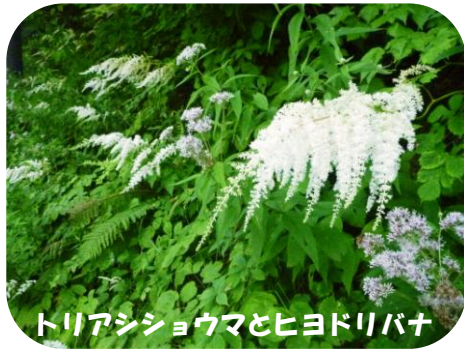
トリアシショウマとヒヨドリバナ