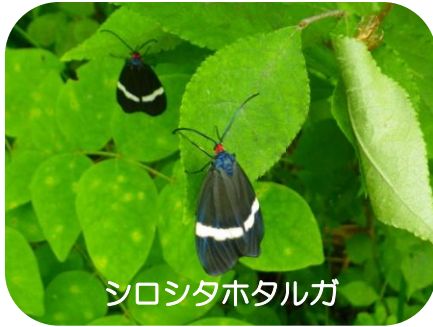
シロシタホタルガ