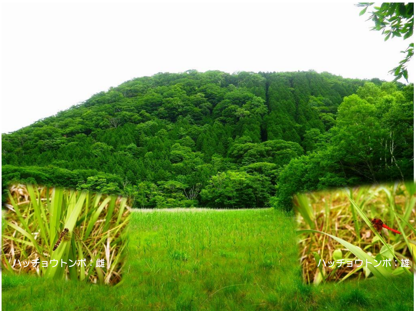
ハッチョウトンボ：雌