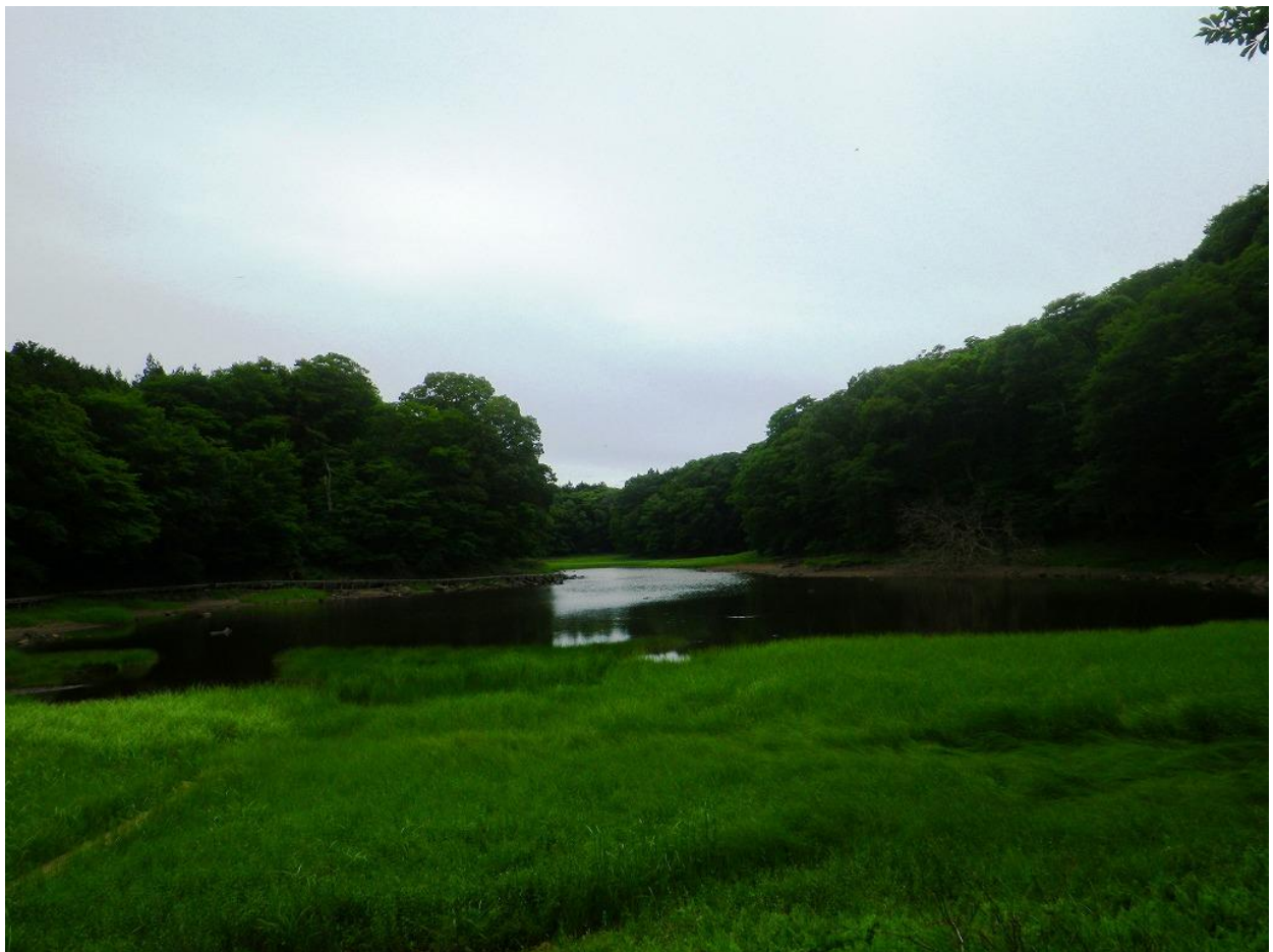
木道より大沼を望む