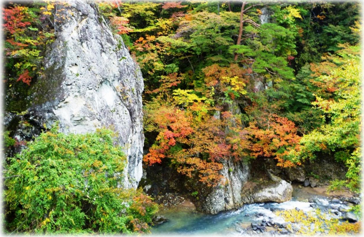
前山歩道「鹿股橋」より

このところあまりお天気が良くないのですが、一気に秋がやってきたみたいです。こんなお天気なので、幻想的な紅葉を見ることができます。塩原温泉の最近の状況をお知らせします。