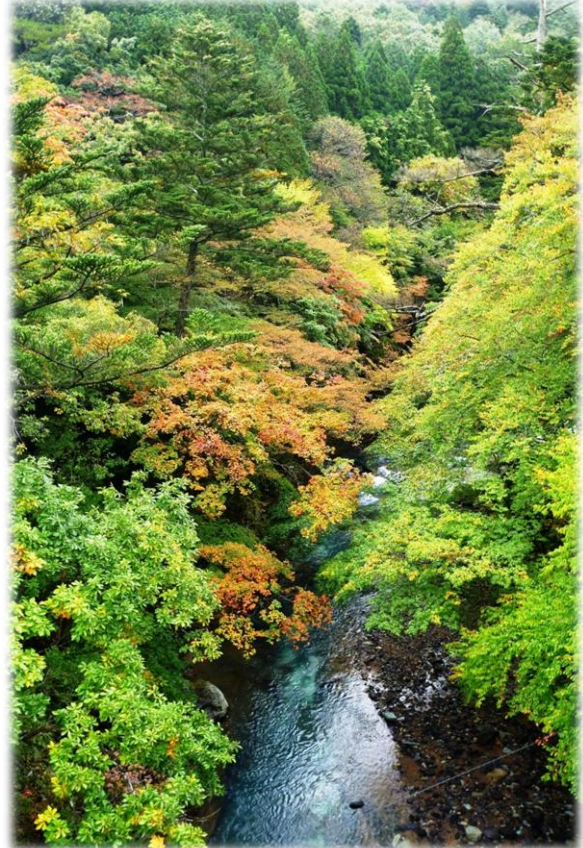
前山歩道「四季の里橋」より