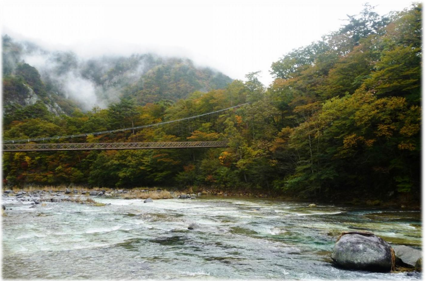
箒川溪谷と七ツ岩吊橋