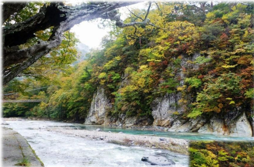
奥に見えるのが七ツ岩吊橋