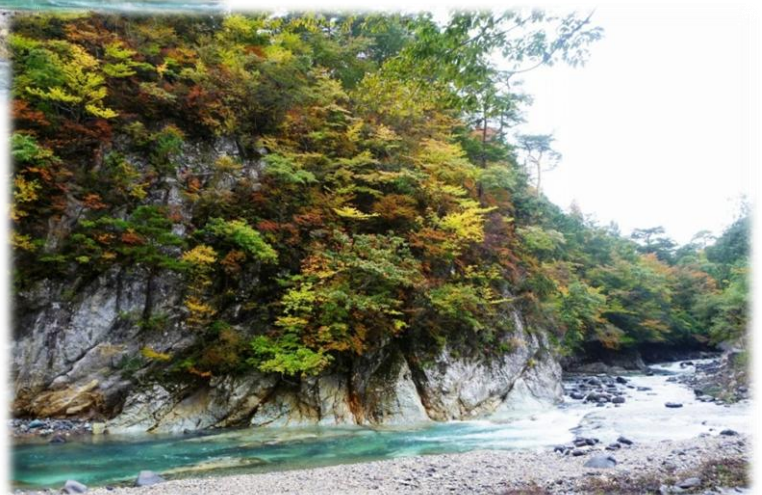
箒川と鹿股川の合流地点