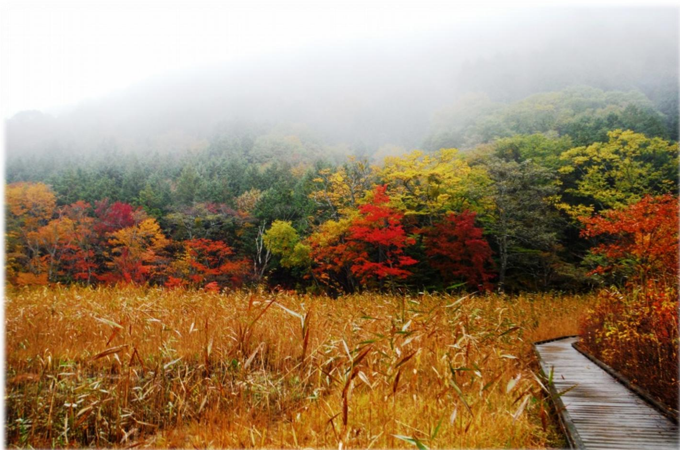
「ヨシ沼」からの新湯富士と、木道を囲む紅葉の森。